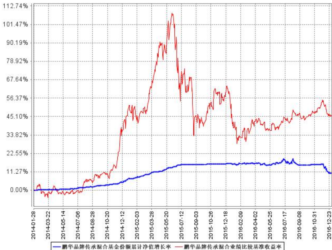
鹏华品牌传承混合基金份额累计净值增长率与同期业绩比较基准收益率的历史走势对比图