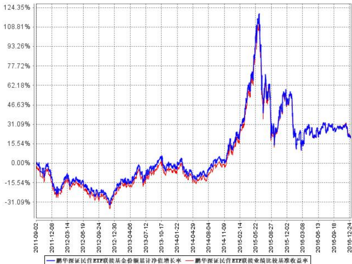
鹏华深证民营ETF联接基金份额累计净值增长率与同期业绩比较基准收益率的历史走势对比图