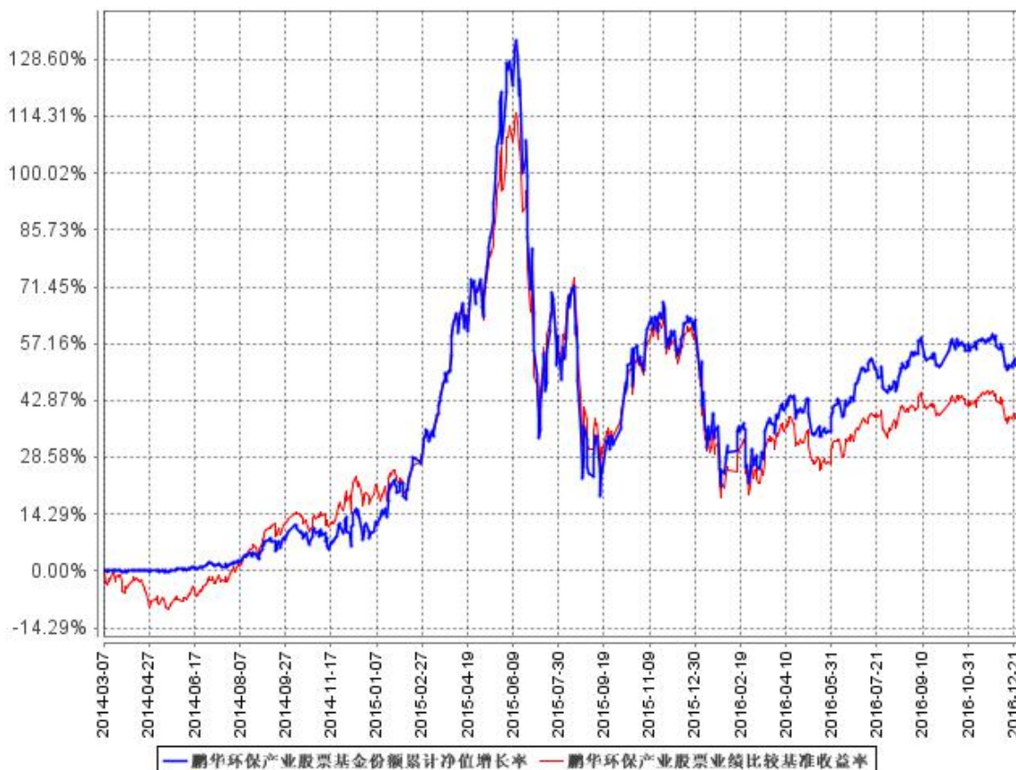
鹏华环保产业股票基金份额累计净值增长率与同期业绩比较基准收益率的历史走势对比图