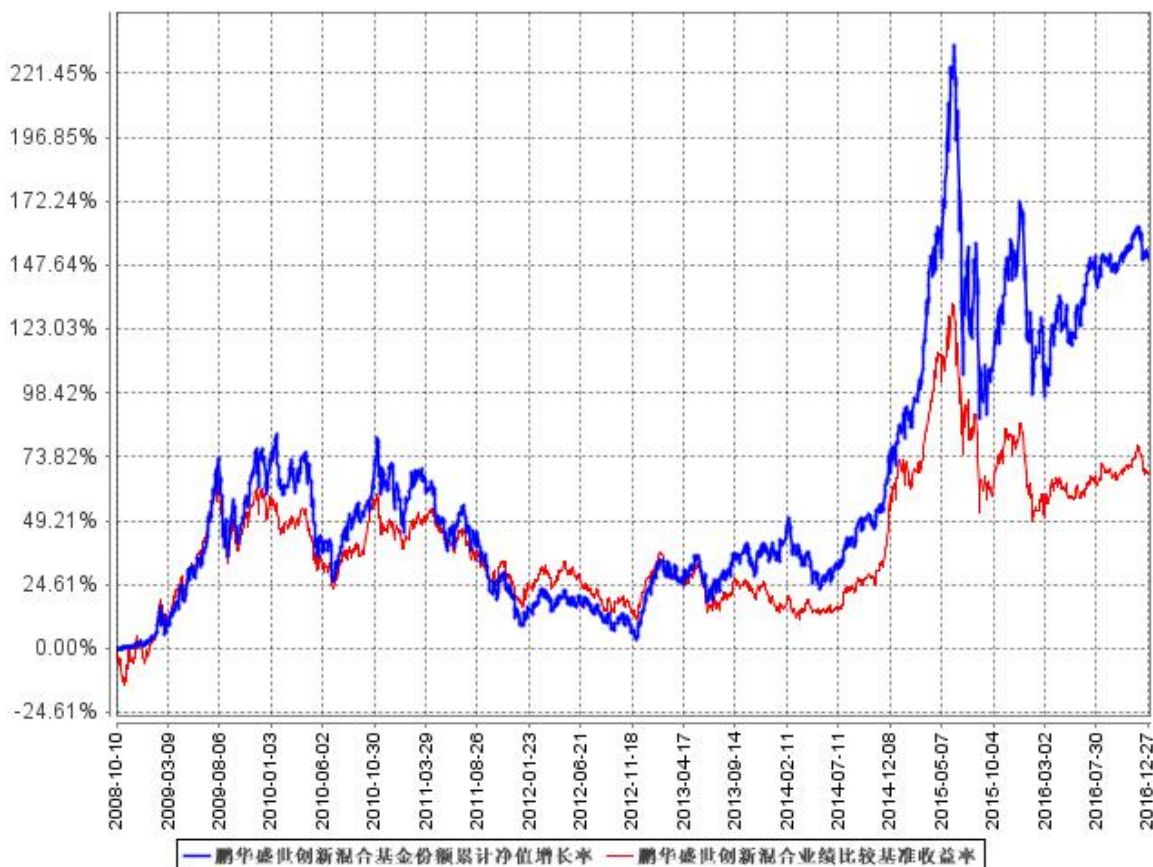
鹏华盛世创新混合基金份额累计净值增长率与同期业绩比较基准收益率的历史走势对比图