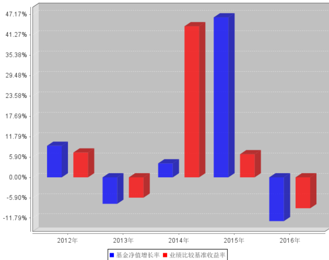
过去五年基金每年净值增长率及其与同期业绩比较基准收益率的对比图