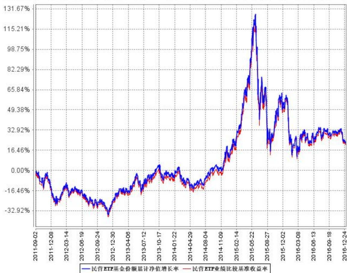
民营ETF基金份额累计净值增长率与同期业绩比较基准收益率的历史走势对比图