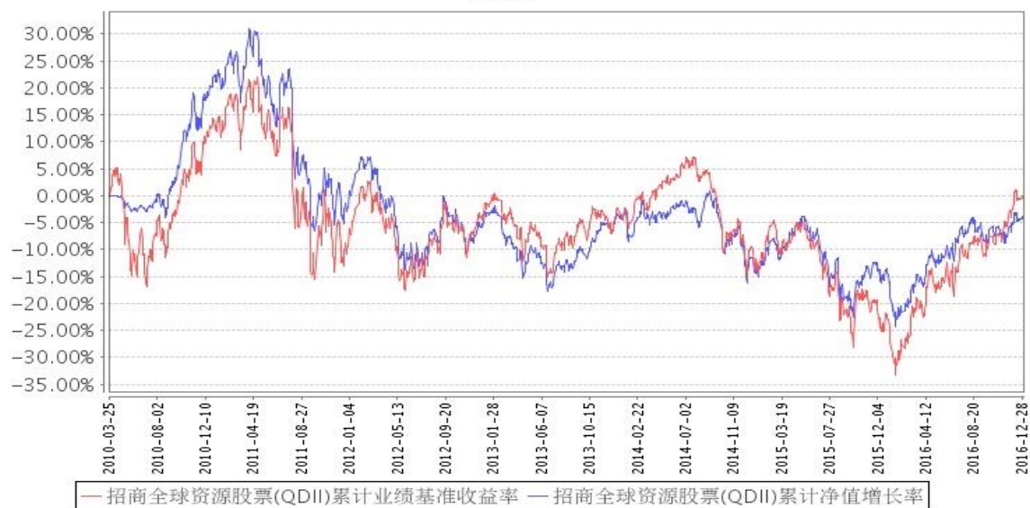
招商全球资源股票(QDII)累计净值增长率与同期业绩比较基准收益率的历史走势对比图