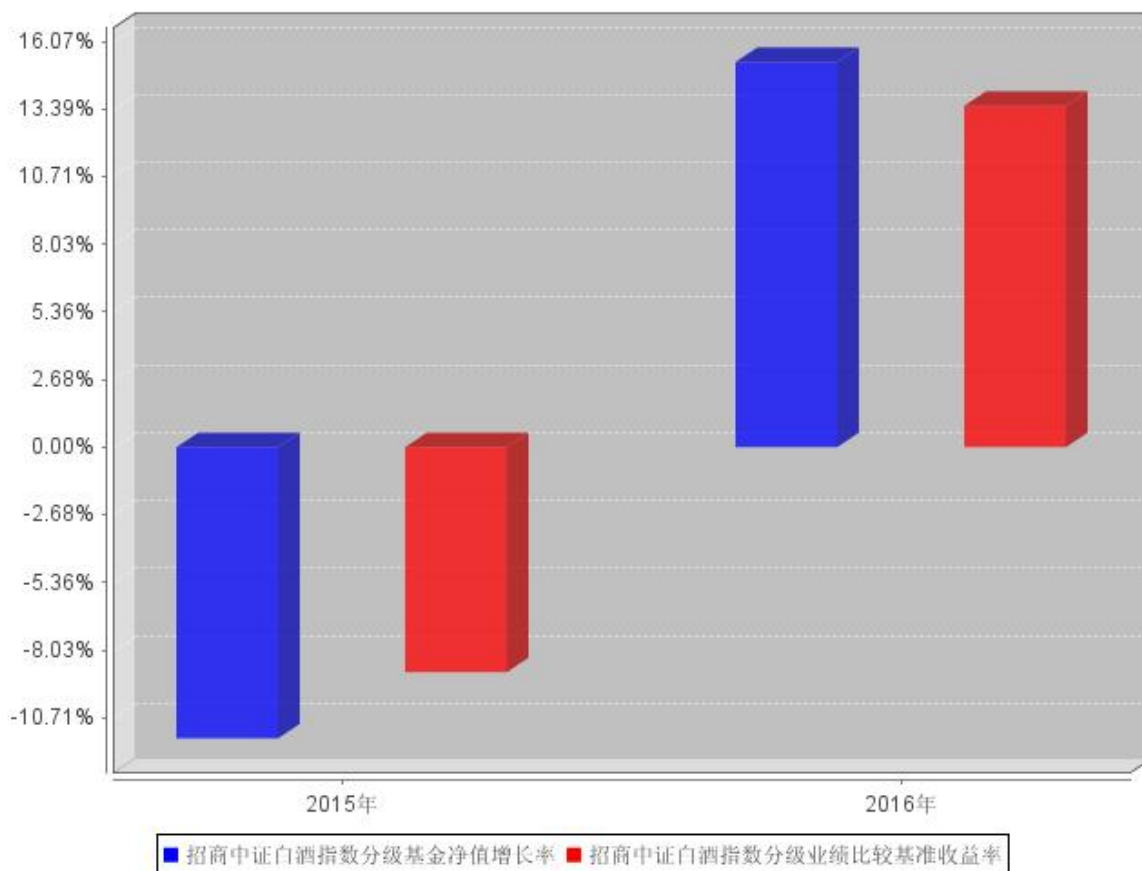
招商中证白酒指数分级自基金合同生效以来基金每年净值增长率及其与同期业绩比较基准收益率的对比图

注：本基金合同于 2015 年 5 月 27 日生效，截至 2015 年 12 月 31 日成立未满 1 年，故成立当年的净值增长率按当年实际存续期计算。