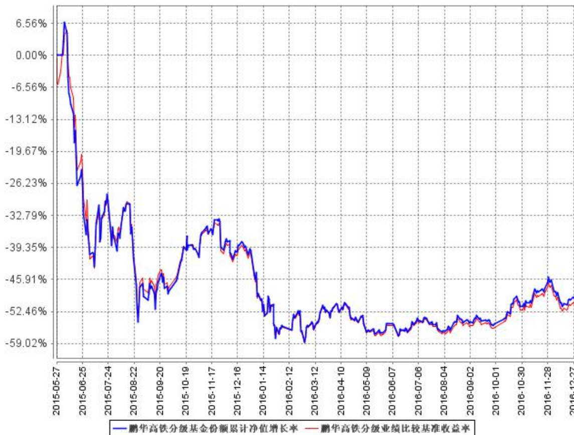
鹏华高铁分级基金份额累计净值增长率与同期业绩比较基准收益率的历史走势对比图