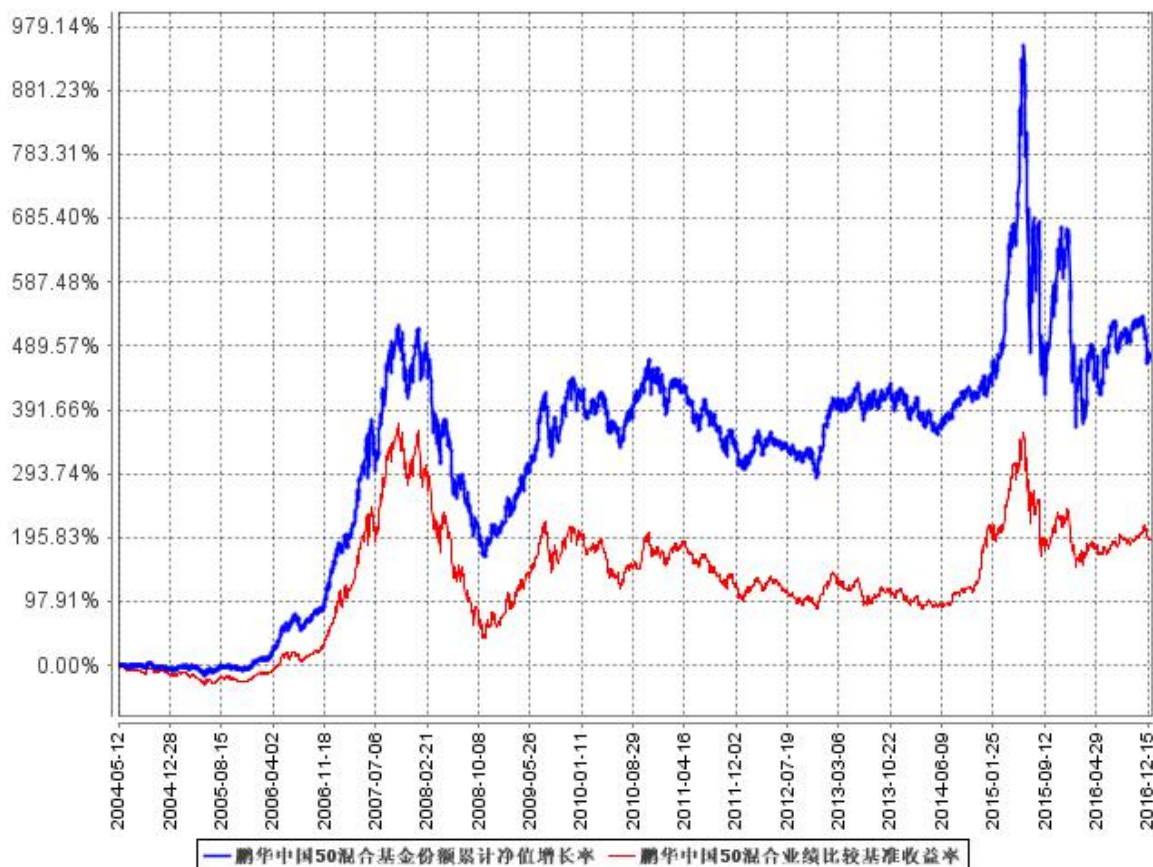
鹏华中国50混合基金份额累计净值增长率与同期业绩比较基准收益率的历史走势对比图