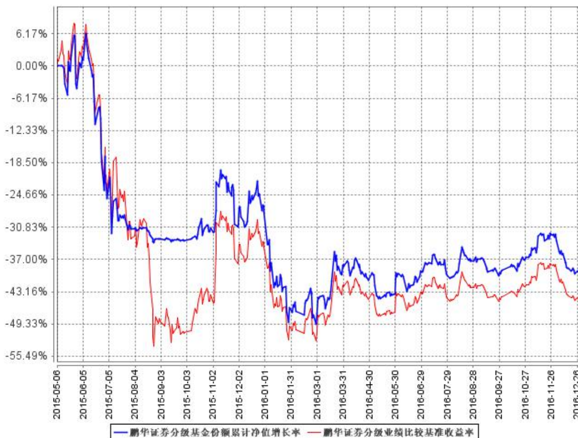
鹏华证券分级基金份额累计净值增长率与同期业绩比较基准收益率的历史走势对比图