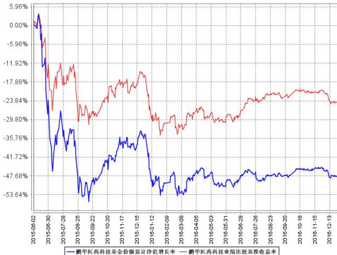
鹏华医药科技基金份额累计净值增长率与同期业绩比较基准收益率的历史走势对比图