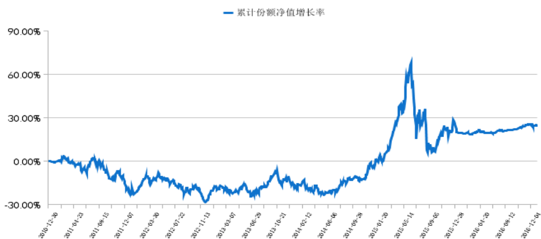
中金中铭1号集合管理计划累计份额净值增长率变动历史走势图 (2010年12月29日至2016年12月31日)

注：本集合计划成立日为2010年12月29日，按照本集合计划合同规定，本集合计划管理人应当自集合计划投资运作期开始日起六个月内使集合计划投资组合比例符合合同的约定。建仓期结束时，本集合计划的各项资产配置比例符合本集合计划合同的有关约定。本报告期内，本集合计划的各项资产配置比例符合集合计划合同约定。