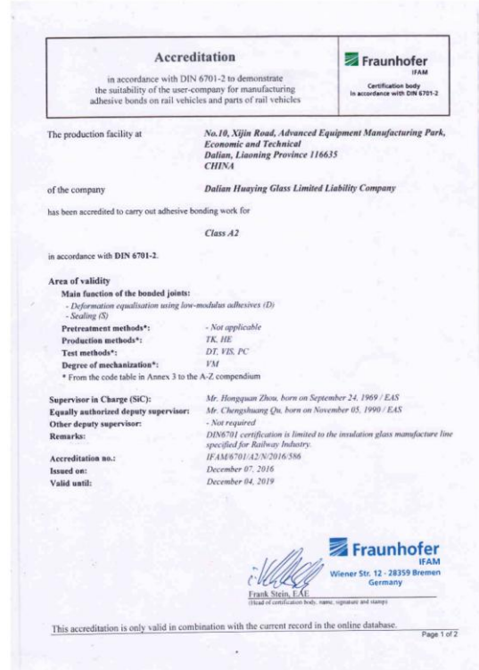
2016 年 12 月取得德国机车粘接认证证书。