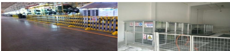
起重吊运作业区域整改

2016 年，公司继续完善公司-工厂二层四级隐患排查治理机制，整合集团安全监督检查队伍，每季度组织综合监督检查，全面开展隐患排查与治理，建立了隐患排查治理体系和安全隐患排查责任追查机制，实现集团公司高度危险源监督检查覆盖率 100%，将各类安全隐患到期整改关闭率提升至 95% 以上。