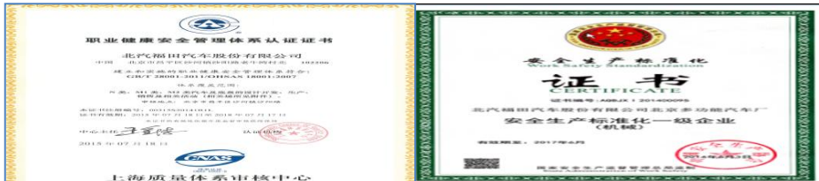
集团总部职安体系证书

2016 年，公司组织了集团职业健康安全体系文件修订、完善，开展了适用法规标准辨识、收集，完成了 12 个模块 932 个法规标准的辨识、收集，推进安全合规管理；建立了完善的职业健康安全管理体系，商用车集团 13 个单位通过第三方职安体系认证，11 个单位通过相应等级的安全生产标准化达标考评，职安体系不断完善，保证企业持续、健康、安全发展。