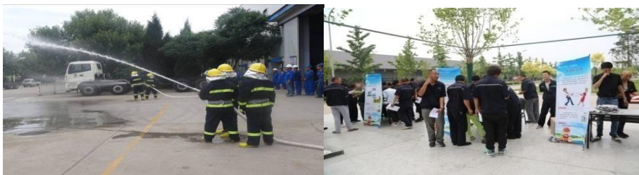
集团下属企业开展“应急演练”

公司组织了开展“安康杯”竞赛活动，通过安全宣传、安全培训、安全演练、安全改善提案等形式，提升生产安全、治安安全、消防安全、公共卫生安全、职业健康安全等意识，加强工会劳动保护监督检查机制。