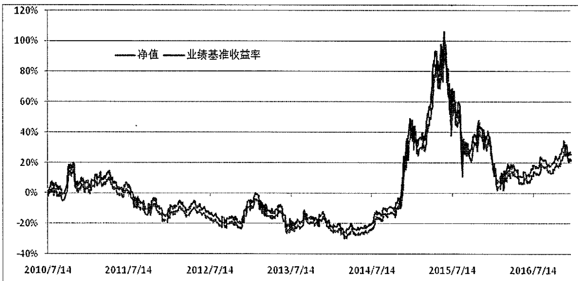
集合计划份额净值增长率与业绩基准收益率的历史走势对比图

(二) 自集合计划合同生效以来集合计划份额净值的变动情况，并与同期业绩比较基准的变动的比较。