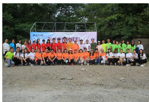
办公室、人力资源、 企管业务线专项培训