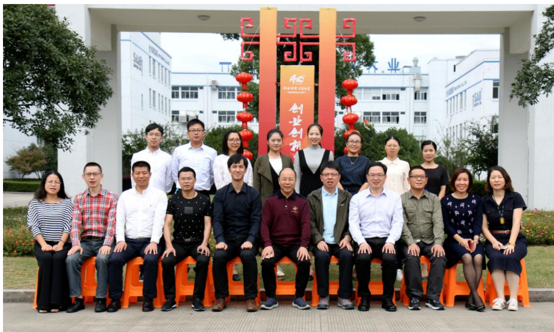
图为公司助理级骨干竞聘会