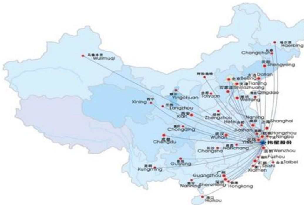
图为公司国内销售网络