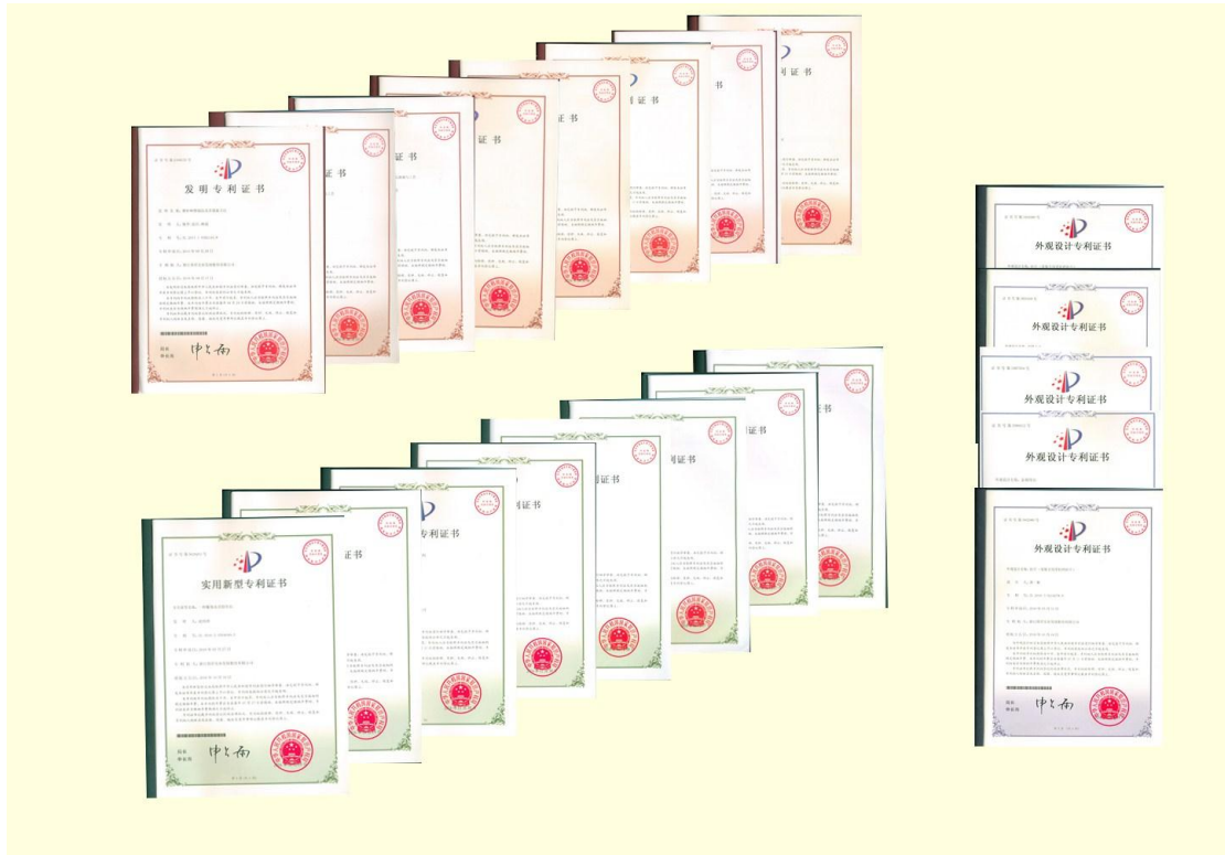
图为公司 2016 年度新获核准的部分专利证书