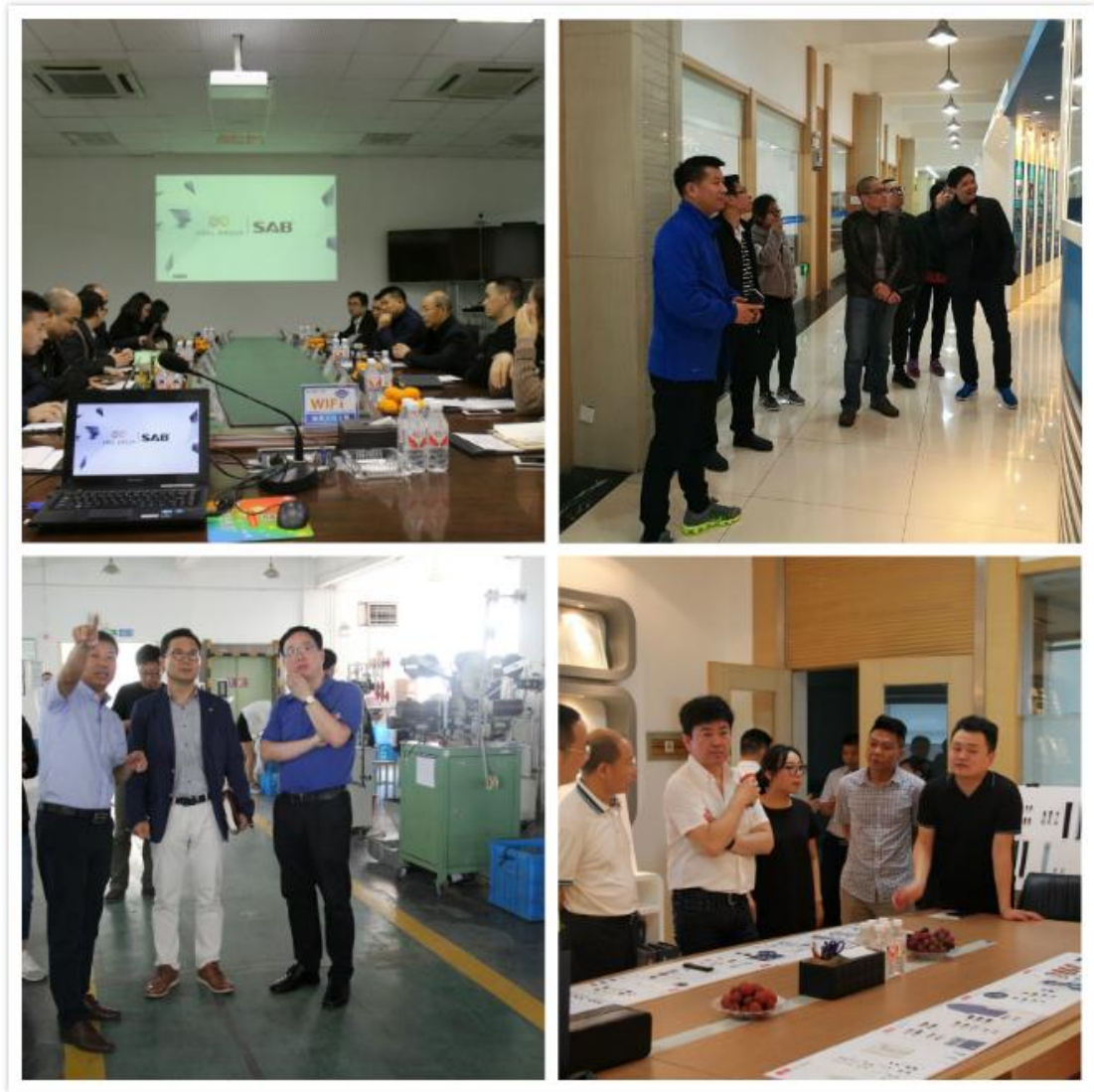
图为公司来访客户

同时，公司稳健的经营风格和强大的研发、服务能力，也是国内外知名服装企业的首选。公司已同波司登、ZARA 和 H&M 等众多国内外知名服装企业建立了战略合作伙伴关系，在持续发展中，彼此合作、互助，一同前行，不断创造更高的价值，实现共赢。