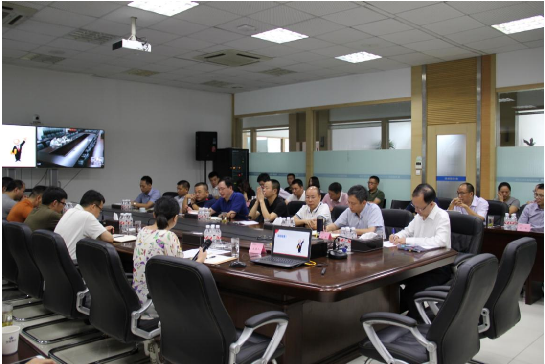
图为领导力提升培训