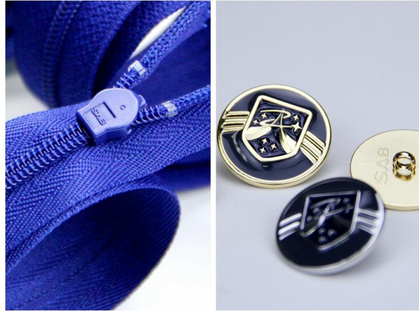
图为杭州 G20 峰会服装 SAB 袖口