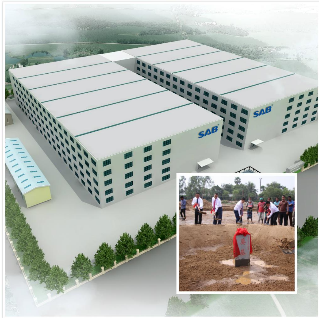
图为孟加拉工业园效果图及奠基仪式