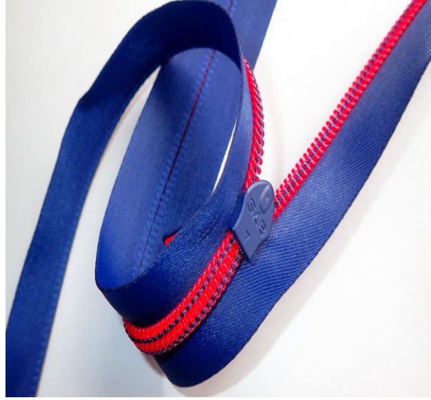
SAB 拉链与里约奥运会的亲密接触