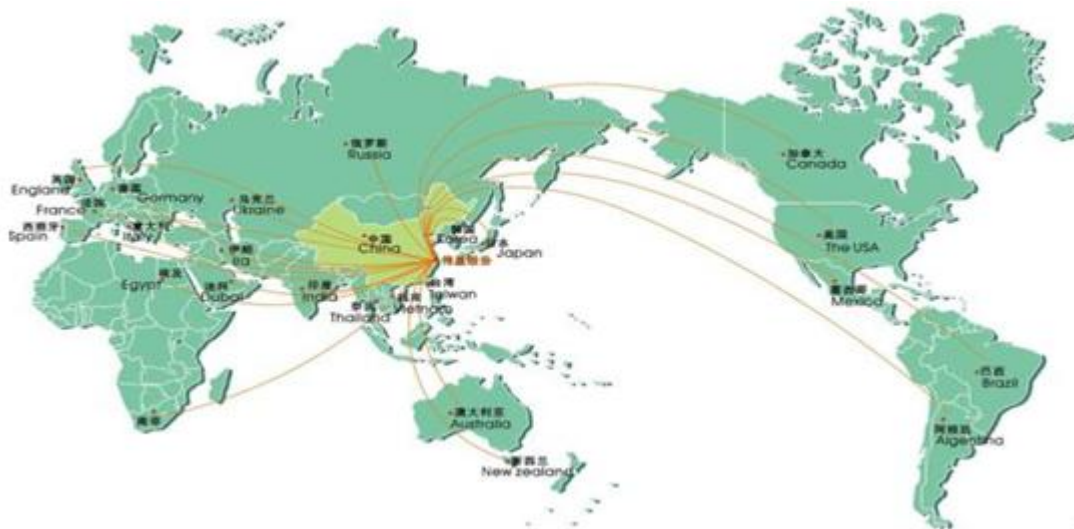
图为公司国际营销网络