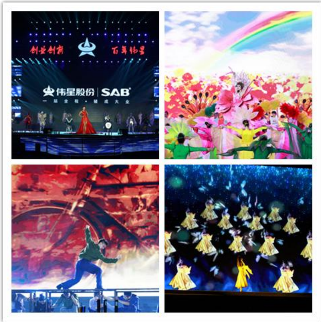
图为“伟星集团四十周年晚会”，公司部分节目