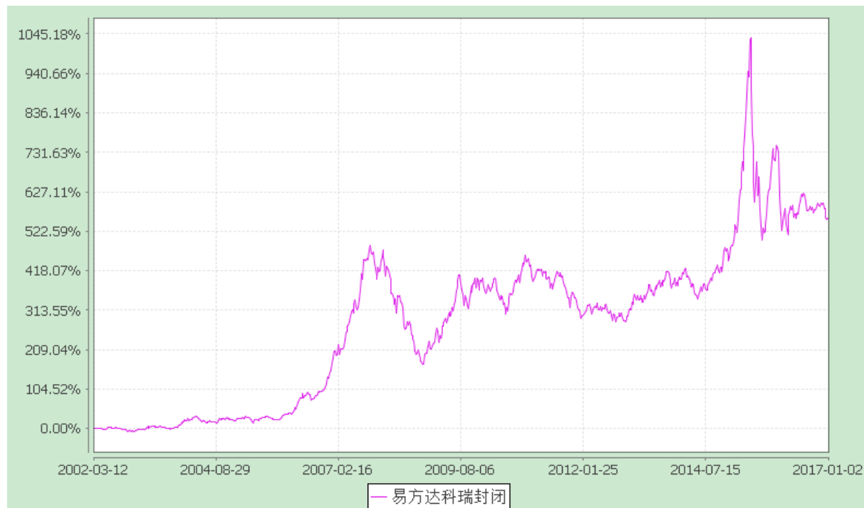
累计净值增长率与业绩比较基准收益率的历史走势对比图 (2002年3月12日至2017年1月2日)