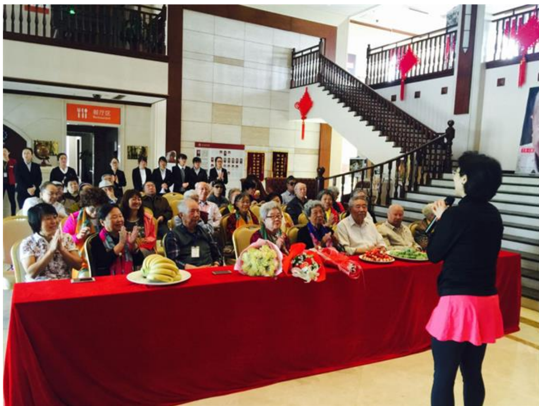
“享受幸福，感恩有您” ——母亲节与柠檬树居家养老和增兴艺术

海航投资旗下全资子公司北京养正结合自身养老业务特色，通过旗下管理的养老机构广泛开展敬老、爱老、助老等各种公益活动，通过为社区内的老年人组织生日会、绘画兴趣班、老年人趣味运动会、母亲节与柠檬树居家养老和增兴艺术团欢聚、五一劳动节与天津市河西区老年艺术团大联欢、快乐赶大集、医疗专家团队健康知识公益讲座、摄影展等活动 20 余次，并通过丰富多彩的活动，发扬互助精神、传播自信、乐观的生活态度，使老年人能保持自由的心境，享受友情与陪伴，体验快乐、获得精彩、闲适、轻松的幸福生活。