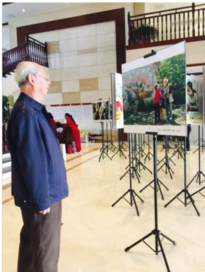
光影重阳，情暖金秋——“海航养正”杯老年摄影展