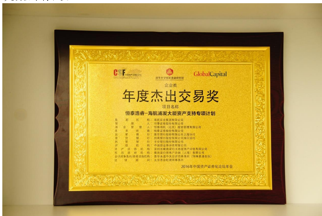
恒泰浩睿-海航浦发大厦资产支持专项计划荣获 2016 中国资产证券

2016年4月8日，海航投资凭借在上海证券交易所顺利发行国内首单以单一写字楼物业为标的资产的类REITs项目“恒泰浩睿-海航浦发大厦资产支持专项计划”荣获2016中国资产证券化年会“年度杰出交易奖”。恒泰浩睿-海航浦发大厦资产支持专项计划是海航投资在不动产金融和资产证券化领域的又一良好创新实践，此次获奖是对公司战略转型决策的肯定。