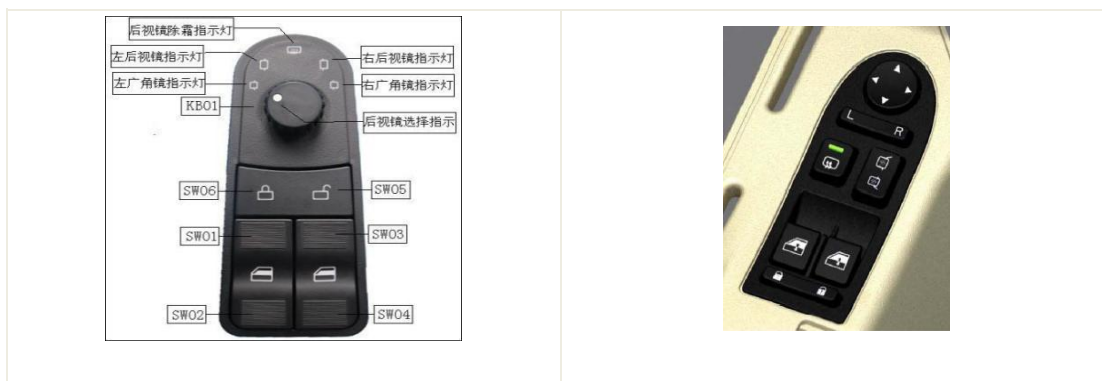
汽车门窗控制器产品

公司于2008年开始研发汽车门窗控制器产品，将来计划开发增设无线钥匙模块。目前，公司的产品防水防尘等级已达到IP53，性能较好。公司目前已搭建门窗耐久试验台架，能够真实的模拟车况，满足门窗耐久试验；在电气方面，公司推进了产品设计平台化建设，能够提高产品的稳定性、缩短开发周期，同时将研发更安全舒适的新型门窗控制器以适应发展趋势。