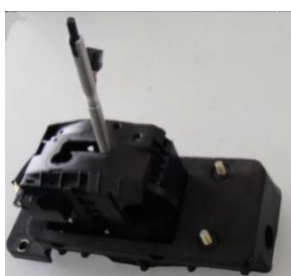
AT换挡控制器 (应用于华晨中华)