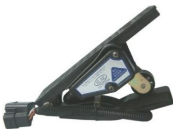
踏板式电子油门踏板总成 (应用于商用车：一汽解放J5M)