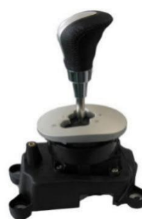
AMT换挡控制器 (应用于江淮同悦)