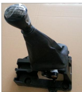
MT换挡控制器 (应用于上汽通用赛欧)