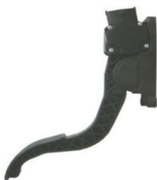
悬挂式电子油门踏板总成 (应用于乘用车：通用新赛欧)