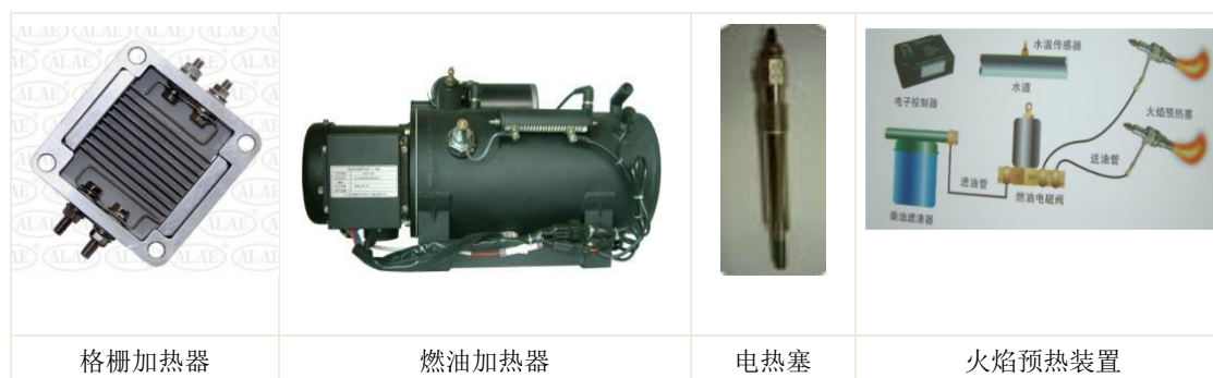
低温启动装置产品分类