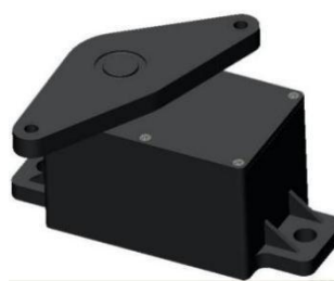
手动式电子油门踏板总成 (应用于中国重汽豪沃)