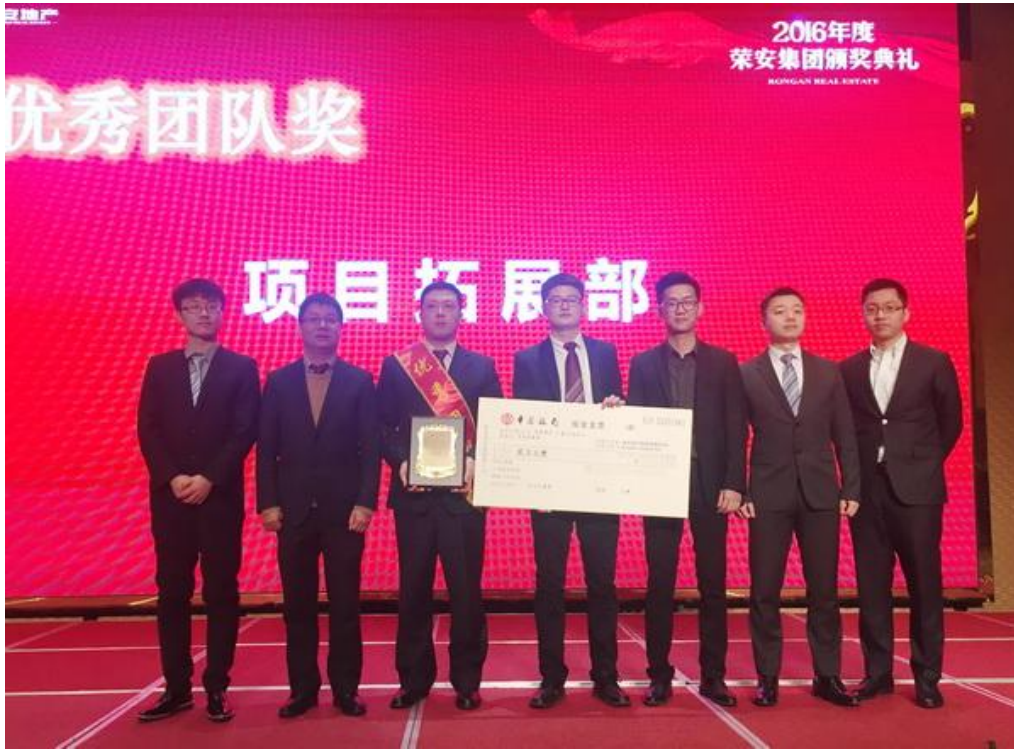
2016 年度颁奖典礼现场