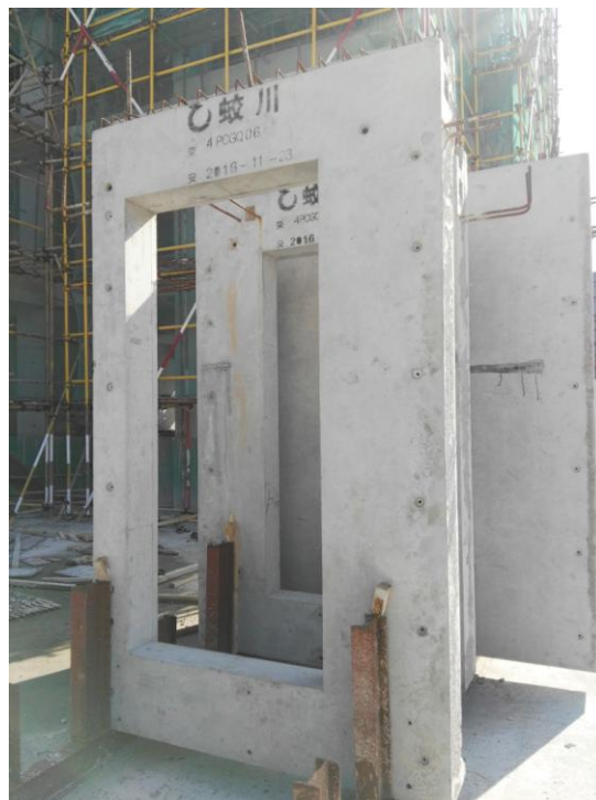
荣安心尚园项目现场使用的预制混凝土构件

荣安地产自 2001 年开始，就设立专项资金投入到建筑节能方向的研究，并将大量的建筑节能新成果应用到新建楼盘上。在产品设计上，荣安普遍采用绿色环保建材、高效能设备，注重户内采光、通风，尽可能提高居住环境的舒适度，不断地为我们的绿色信仰赋予更新的内涵。2016 年，公司按照《浙江省绿色建筑条例》有关要求，大力推进绿色建筑发展，促进建筑产业现代化，开始在荣安心尚园项目中使用预制混凝土构件。由于大量的构件都在工厂生产，减少了现场施工强度，省去了砌筑和抹灰工序，大大缩短了整体工期；通过预制件工厂化生产和现场装配施工，大量减少建筑垃圾和废水排放，降低建筑噪音，降低有害气体及粉尘的排放；与传统建造的住宅相比，整体提高住宅整体安全等级、防火性和耐久性。