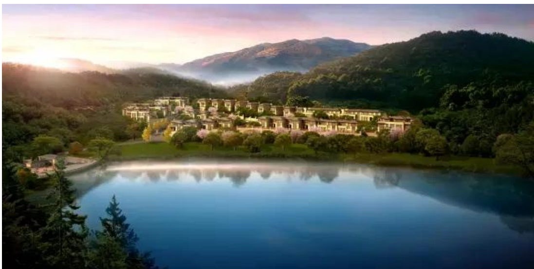
东钱湖畔的荣安山语湖苑效果图