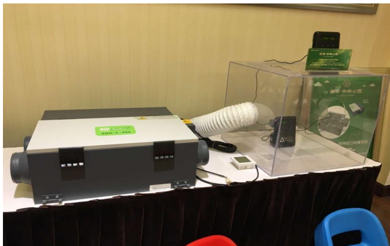
在项目中应用的恩科新风、空气净化系统展示