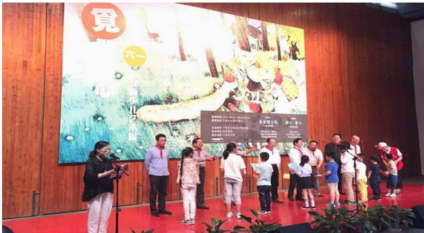
2016 荣安杯少儿艺术展开幕式

荣安积极参与社会各项公益事业。在 2016 年“六一”儿童节前夕，荣安联合宁波美术馆等单位，联合举办荣安杯庆“六一”少儿艺术展。从 2007 年开始，每年的“荣安杯”，都是留给小朋友们的最好的礼物。如今的“荣安杯”，已经成为了宁波市青少年重要的书画赛事之一，在社会上享有很高的影响力和美誉度。