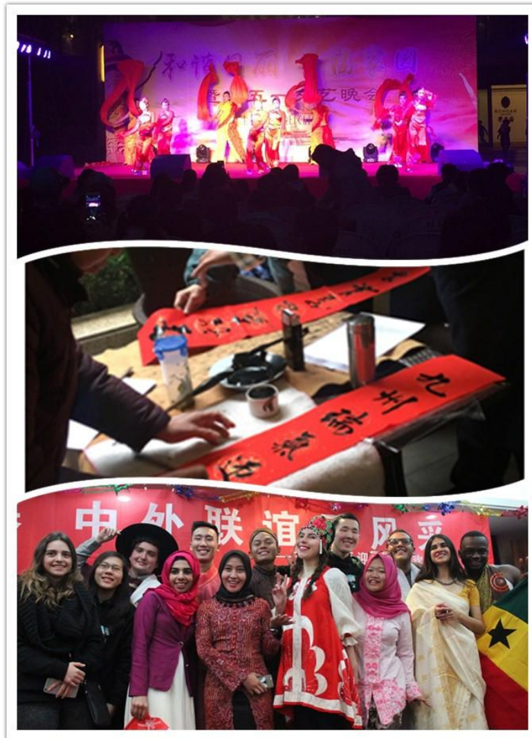
各个小区举行的丰富多彩的社区活动现场

作为打造优秀社区文化的重要举措，元宵、五一、十一、中秋……每个节假日，荣安各个小区都有精彩纷呈的社区活动丰富业主生活。