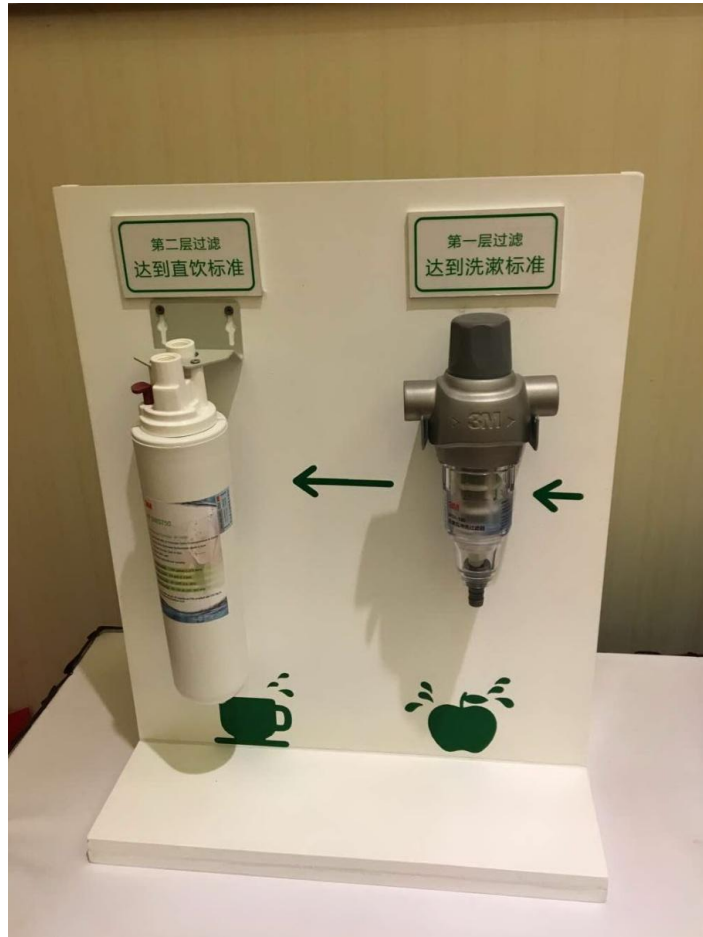
在项目中应用的 3M 净水系统展示

2016 年，荣安地产在以往的基础上，进一步强化社区的防霾举措，除了要求开发的项目强调与生态结合，并开始在项目引入净水系统及新风、空气净化系统，在甬城率先推出“防霾社区”概念，提倡城市绿色生活方式。