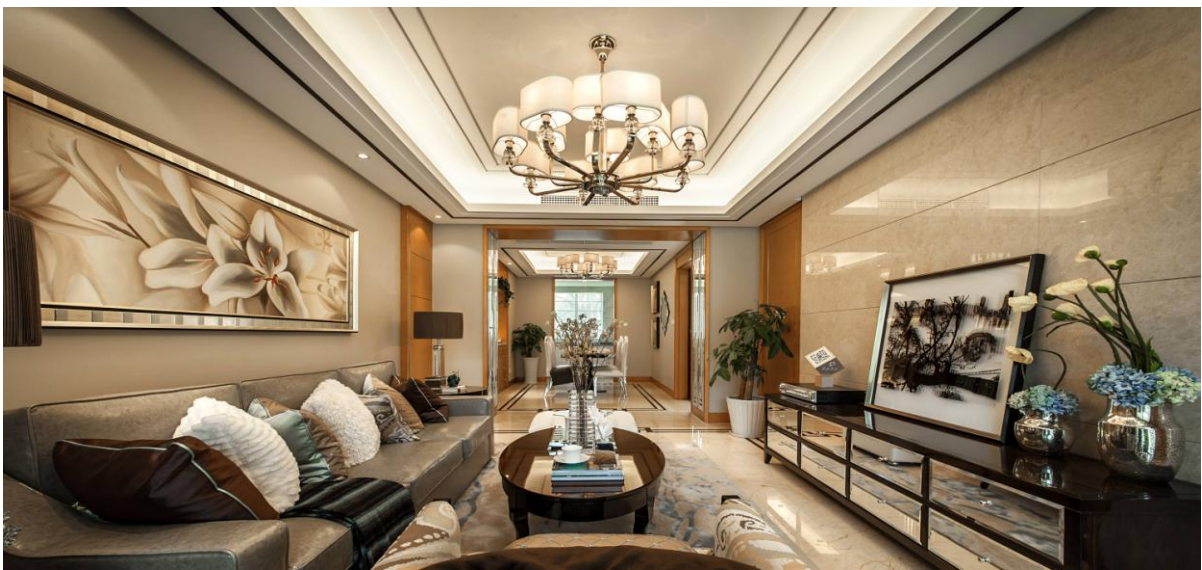
荣安香园 2 期精装修样板房实景图

董事长王久芳曾在 2014 年度会议报告中指出：做节能、环保、生态、健康、服务好的住宅是我们公司未来产品发展方向。多年的精装修项目使得公司在设计、选材、施工、现场管理等各方面都积累了丰富的经验，2016 年公司开发的荣安香园 2 期、代建项目荣安观江园、荣安心尚园都采用了精装修工程。我们的精装修产品，不仅外表高贵、典雅，而且在收纳空间等人性化方面做足了功课，在体现产品的价值感之余，还让客户感觉到了我们追求完美的责任与情怀。