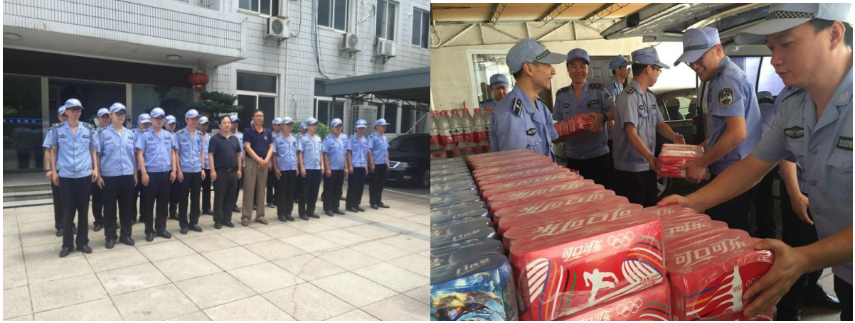
慰问一线城管人员

作为打造优秀社区文化的重要举措，元宵、五一、十一、中秋……每个节假日，荣安各个小区都有精彩纷呈的社区活动丰富业主生活。