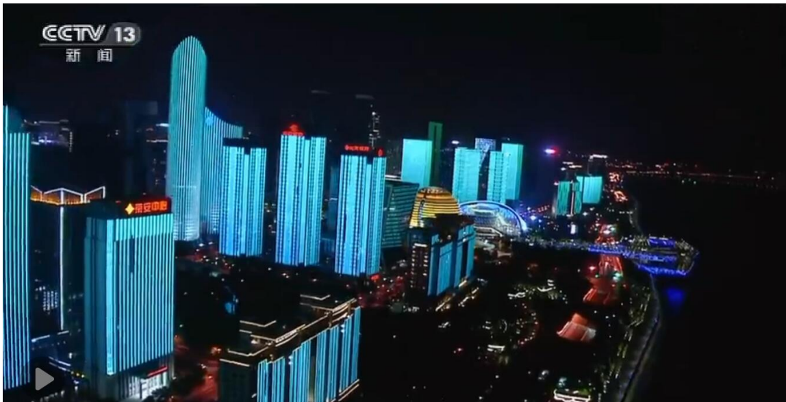
杭州荣安中心在 G20 峰会核心区亮相

荣安地产深刻认识到，企业社会责任是企业通向可持续发展的重要途径，它符合社会整体对企业的合理期望，不但不会分散企业的精力，反而能够提高企业的竞争力和声誉。在新的社会和市场环境下，2016 年，荣安地产积极主动地承担社会责任，在更深层次和更大程度上倾力支持扶贫、青少年发展、文化体育等慈善公益事业。荣安将一如既往地秉承“正德厚生、笃学敏行”的企业训言，感恩客户，感恩合作伙伴，向全国一流房地产开发企业的目标稳步迈进。