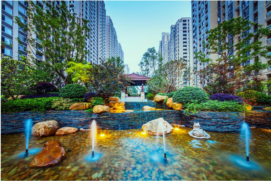
荣安香园园区实景图

把景观绿化做到极致，是荣安开发住宅项目的一大特色。2016 年开发的“荣安·心尚园”、“荣安·香园 2 期”、“荣安·山语湖苑”，光看小区的名字就能让人浮想联翩，眼前呈现鸟语花香、温馨的家庭园林氛围。荣安的景观有三个层次，第一，是有视觉效果的景观，有美感，绿化率高；第二，是有文化的景观，具备精神内涵；第三，是生态型景观，保证低碳和宜居，让小区拥有完整的生物链，鸟语花香，负氧离子高。