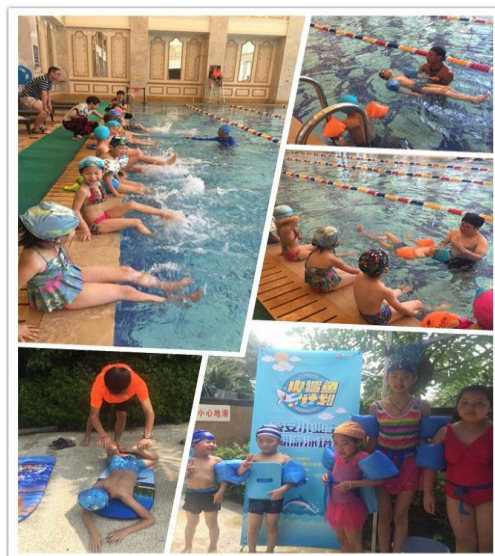
“小鲨鱼计划”游泳培训

2016 年，重阳节前后，荣安派专人走访慰问了部分 70 周岁以上的老年业主，向他们带去了公司的问候，体现出一种浓浓的人文关怀。暑期则针对所有荣安小区的小业主推出了“小鲨鱼计划”游泳培训，让小业主能轻松学游泳。