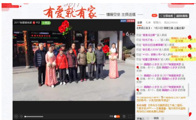
“情暖空巢，主播送福”，六间房传递网络正能量

2016 年，公司在 IP、网红、科技等领域取得了一系列突破。公司旗下子公司宋城娱乐打造的中国大型演艺女团“树屋女孩”成为新晋网红，同名主打歌曲《树屋女孩》荣登 QQ 音乐巅峰榜，线上线下活动不断，收获大量粉丝。同时，由宋城娱乐与录客联合出品的青春悬疑性别穿越喜剧《攻爆基丁》于 2016 年 11 月正式开机。