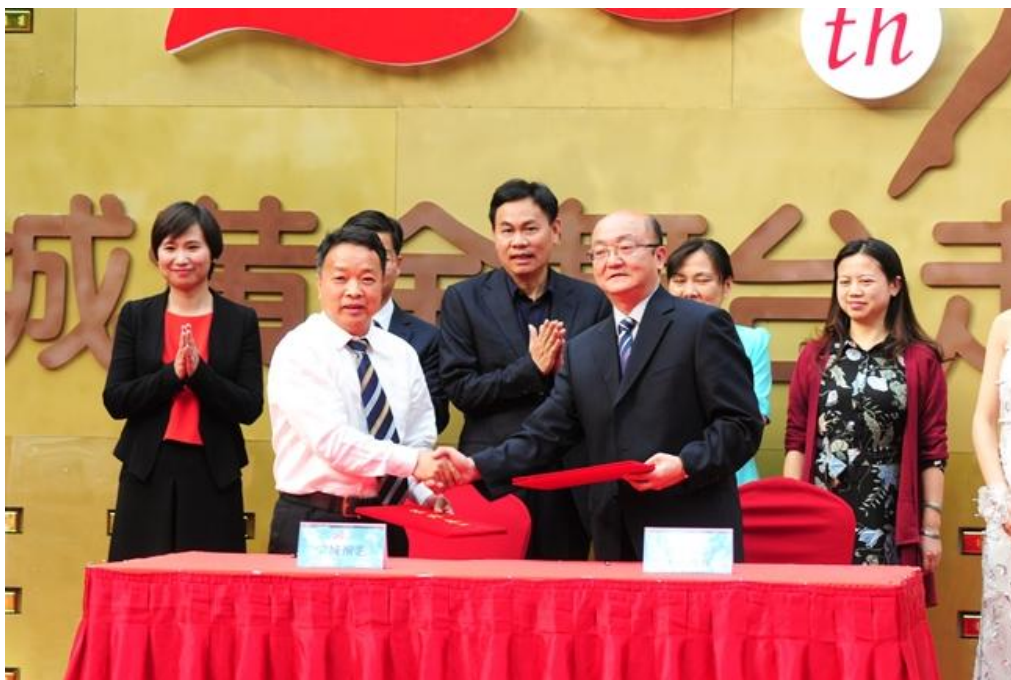
2016年5月18日，宋城演艺与张家界市政府正式签订《张家界千古情》项目

目前，上海、桂林等项目正在积极推进中，已基本完成各大项目所有演出的策划和编创及景区的规划和设计工作，凭借公司异地项目成功复制所积累的经验，新一批项目的后期工程建设、节目编创将更加高效，同时鉴于项目所处地均为市场潜力更大的一线旅游目的地，未来本轮复制拓展的项目将继续获得超预期的成功。