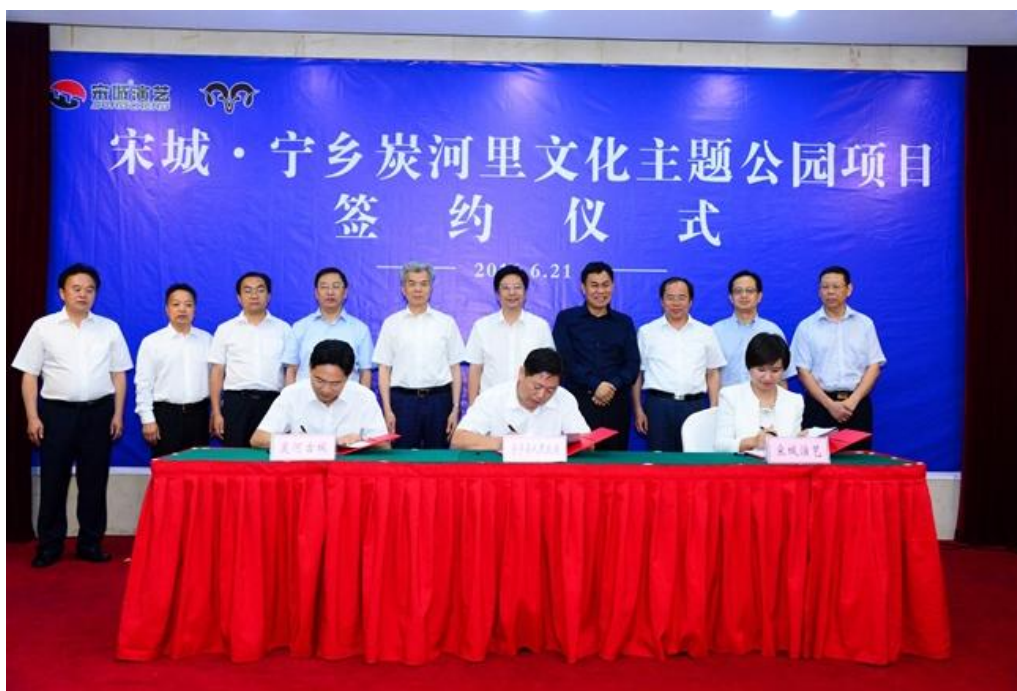
2016 年 6 月 21 日，宋城·宁乡炭河里项目签约

2016 年 6 月，公司全资子公司杭州宋城旅游发展有限公司与长沙宁乡县炭河古城文化旅游投资建设开发有限公司、宁乡县人民政府就“宋城·宁乡炭河里文化主题公园”项目签署《项目合作协议》。杭州宋城旅游发展有限公司成为承载公司轻资产输出的主体，提供旅游综合体、旅游度假区、景区、主题公园及文化演艺项目的品牌授权、演出剧目编导、规划设计、工程建设、科技体验项目制作、市场营销、旅游电子商务、策划推广、景区委托运营管理等服务。