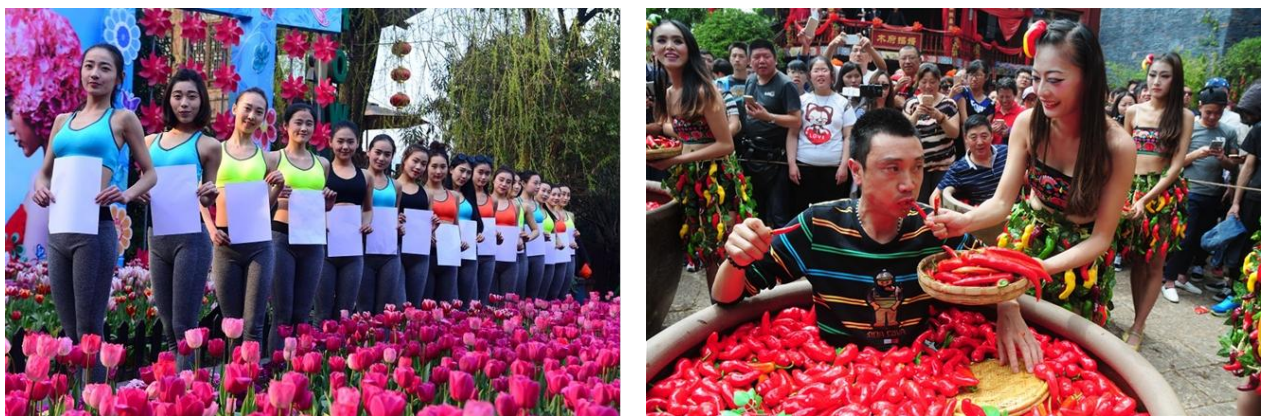
杭州宋城旅游区花痴节，美女演员鲜花丛中大秀A4腰