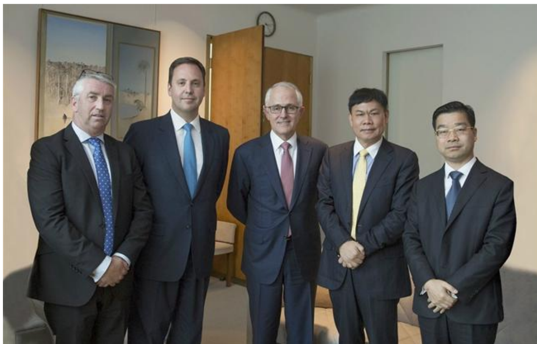
澳大利亚总理马尔科姆·特恩布尔会见黄巧灵董事长

黄金海岸作为一个世界知名的旅游度假目的地，演艺市场基本属于空白，游客对于多元化旅游度假产品的需求非常高。公司经过自身和第三方机构前期对澳大利亚和黄金海岸旅游市场的深度调研，充分发挥自身优势与当地实际情况相结合，使得宋城澳洲的传奇王国和其他同类型项目相比，在市场定位、产品特色等方面具有极强的竞争力。海外第一个项目的布局，对公司发展无疑意义重大。