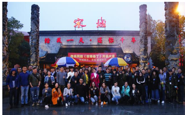
首部演艺女团与虚拟偶像参演网剧《攻爆基丁》开机