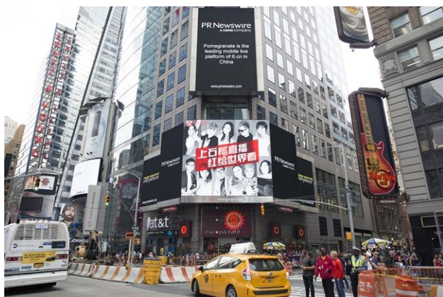
纽约时代广场石榴直播活动宣传

在娱乐直播领域，六间房已经成为行业内产品线最全、业务模式最完整、盈利能力最强的娱乐直播平台之一。从产品角度，公司的桌面平台“六间房秀场”与移动平台“石榴直播”拥有庞大的用户社群、成熟的产品形态，服务了用户在桌面的重度娱乐与移动的轻度娱乐两种体验场景；从业务模式角度，六间房覆盖了个人与机构表演者的全部内容源形态，同时深度经营用户的交互体验，形成了以娱乐直播为基础的 C2C、B2C 闭环社区。优秀的产品能力与成熟的业务模式，推动公司的娱乐直播业务进入高速的利润释放期。公司将持续加大在用户获取、品牌建设等领域的投入，提升六间房直播业务线的整体竞争力。