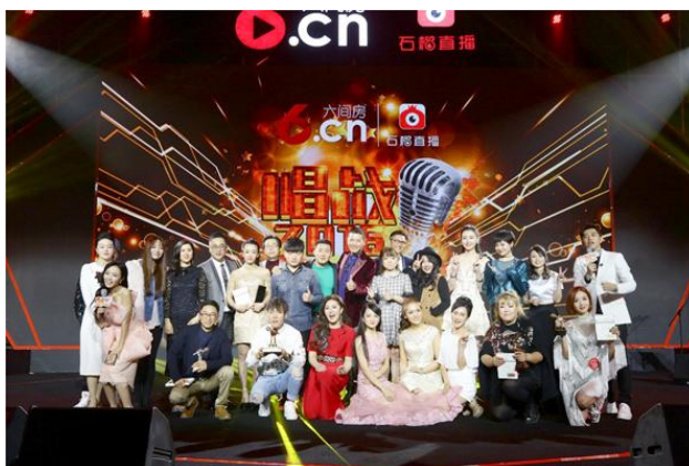
《唱战 2016》绽放水立方，荣耀五周年

在强化现有主线业务的同时，公司进行了大量的新业务、新技术的储备。在战略层面，六间房将在未来通过主动发起、外延整合等方式开拓新的业务领域，充分发挥公司在知识经验、行业网络、品牌与用户群等领域的优势，在未来数年内发展为领先的综合性数字娱乐企业；在技术层面，公司通过自有团队研发与外部合作，投入大量人员与资金研究开发增强现实、大数据、人工智能等前瞻性科技手段在直播与相关娱乐领域的应用，并预计将在未来数年内持续进入产品化与商业化阶段。