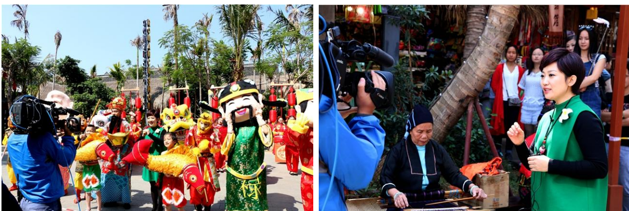
CCTV-1《新闻联播》、CCTV-4《传奇中国节—春节》、CCTV-13《新闻直播间》等轮番直播2016 三亚宋城旅游区黎苗新春大庙会

湖景区推出万圣主题活动，并在其主题活动的引导下开展了多个广受年轻群体热爱的专题活动。