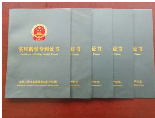
4.2016年3~9月分别取得五项实用新型技术专利证书。