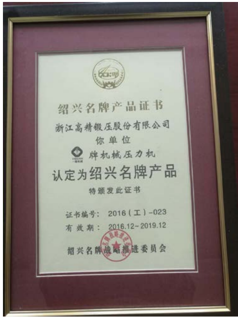
5.2016年12月公司机械压力机产品被认定为绍兴名牌产品。