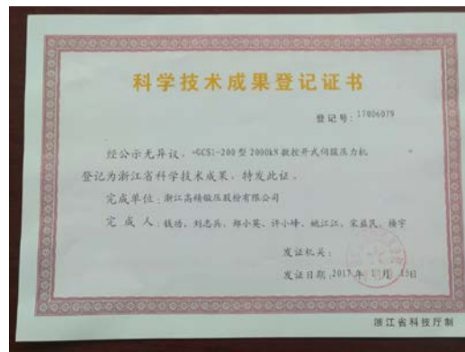
6.2016年12月GCS1-200数控伺服压力机产品作为省级新产品、新技术鉴定，认定该技术处于国内同类产品领先水平。