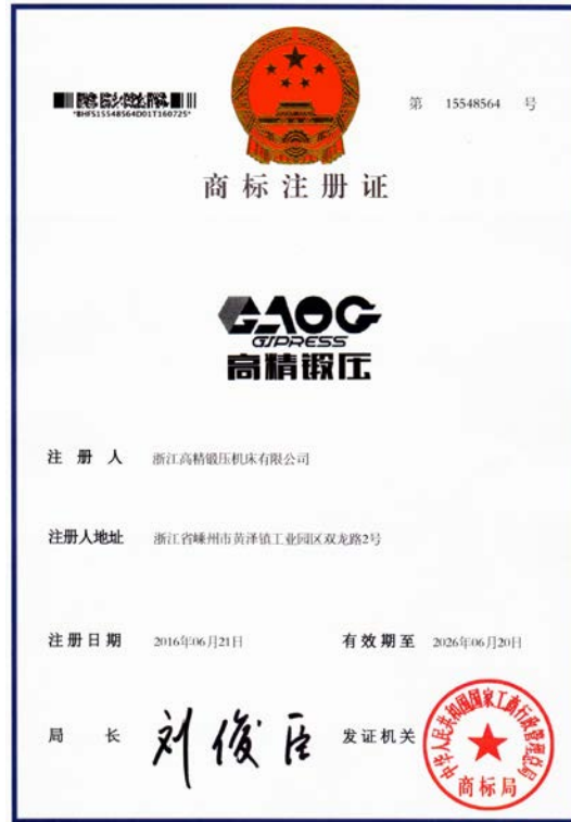
2.2016年6月“高精锻压”商标注册成功。