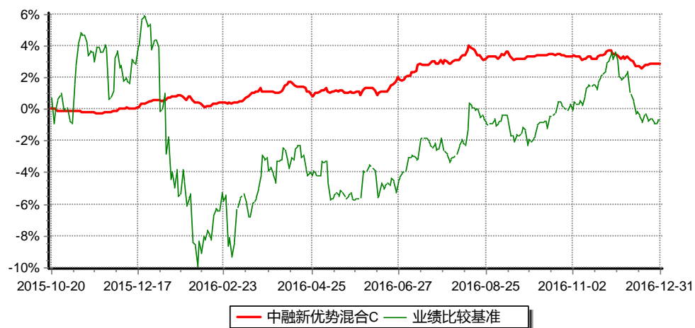
图：中融新优势混合C累计净值增长率与同期业绩比较基准收益率的历史走势对比图（2015年10月20日至2016年12月31日）

注：按基金合同和招募说明书的约定，本基金自基金合同生效日起6个月内为建仓期，建仓期结束时本基金的各项投资比例符合基金合同的有关约定。