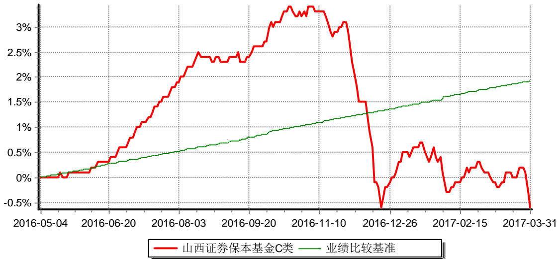
累计净值增长率与业绩比较基准收益率历史走势对比图 (2016年05月04日-2017年03月31日)

注：1、本基金基金合同生效日为2016年5月4日，至本报告期末，本基金运作时间未满一年； 2、按基金合同和招募说明书的约定，本基金的建仓期为六个月，基金管理人自基金合同生效之日起六个月内已使基金的各项资产配置比例符合基金合同（第十三部分二、投资范围，三、投资策略和四、投资限制）的有关约定。