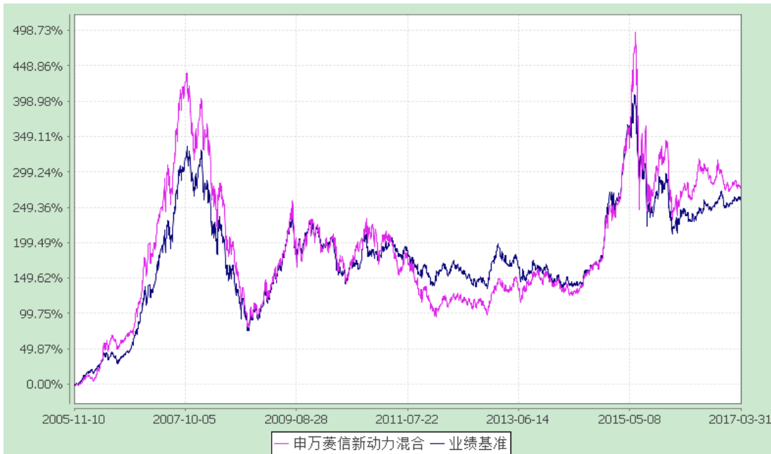
申万菱信新动力混合型证券投资基金 累计净值增长率与业绩比较基准收益率历史走势对比图 (2005年11月10日至2017年3月31日)

2. 自《基金合同》生效以来基金份额累计净值增长率与同期业绩比较基准的变动比较。