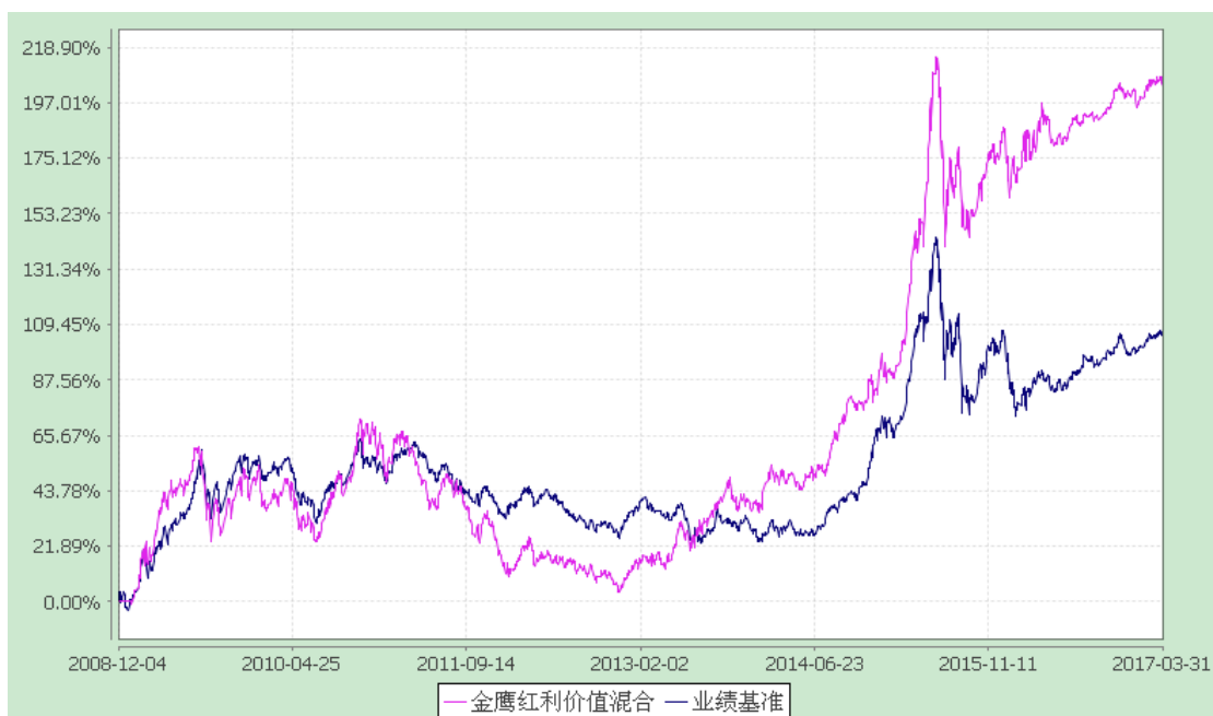
金鹰红利价值灵活配置混合型证券投资基金 累计净值增长率与业绩比较基准收益率历史走势对比图 (2008 年 12 月 4 日至 2017 年 3 月 31 日)

注：(1) 截至报告日本基金的各项投资比例已达到基金合同规定的各项比例；(2) 本基金的业绩比较基准为：中证红利指数收益率×60%+上证国债指数收益率×40%。