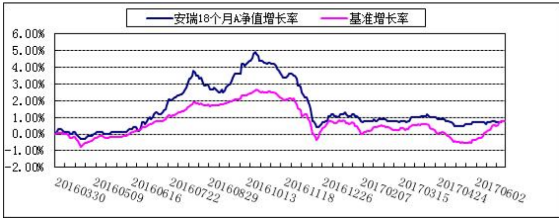
2. 博时安瑞18个月定开债C: