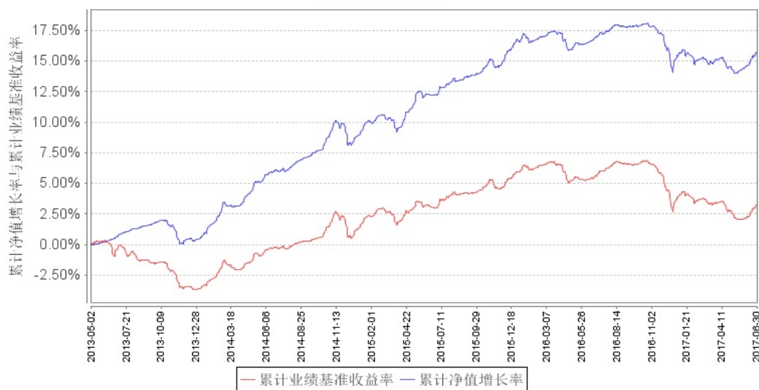
南方中债中期票据指数债券发起A累计净值增长率与同期业绩比较基准收益率的历史走势对比图