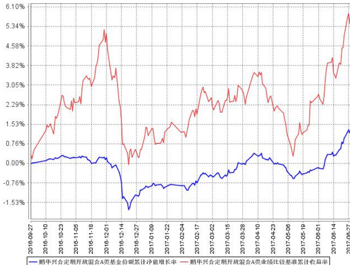
鹏华兴合定期开放混合A类基金份额累计净值增长率与同期业绩比较基准收益率的历史走势对比图