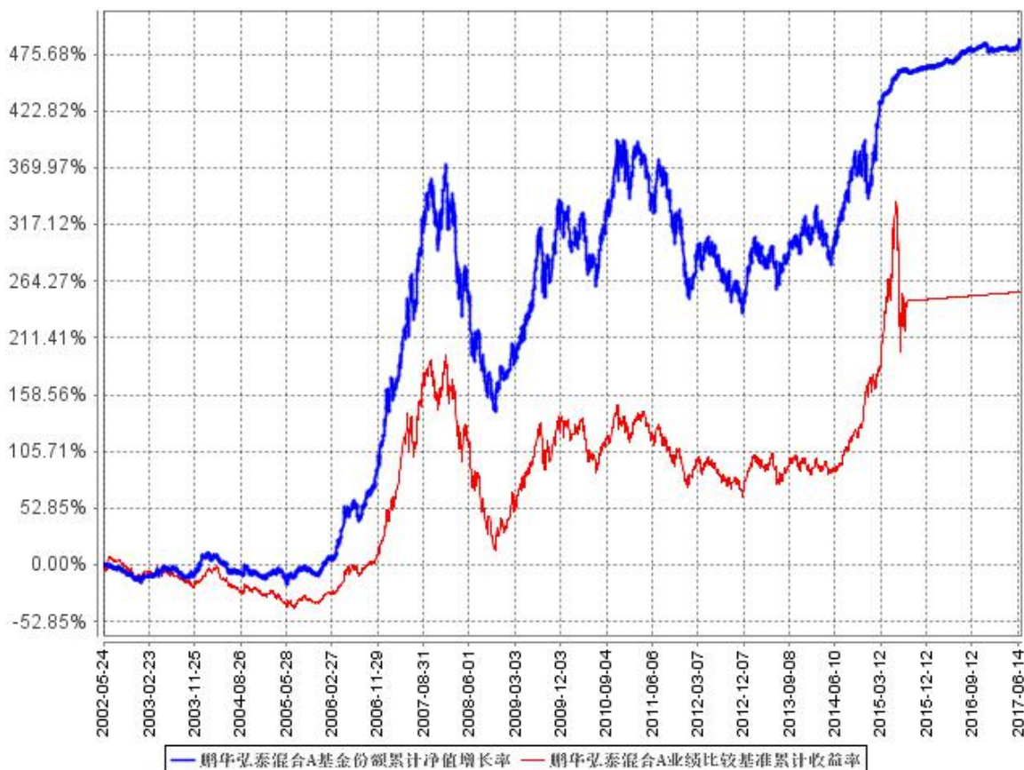
鹏华弘泰混合A基金份额累计净值增长率与同期业绩比较基准收益率的历史走势对比图