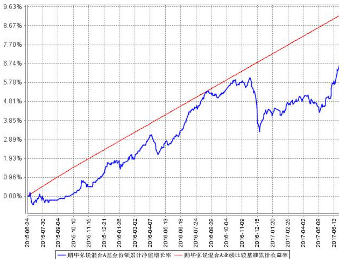
鹏华弘锐混合A基金份额累计净值增长率与同期业绩比较基准收益率的历史走势对比图