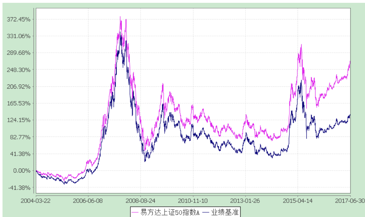
易方达上证 50 指数 C