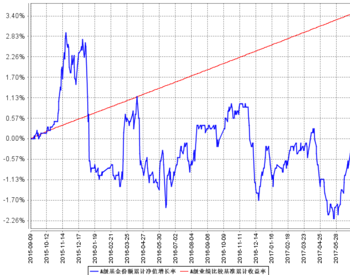
A级基金份额累计净值增长率与同期业绩比较基准收益率的历史走势对比图