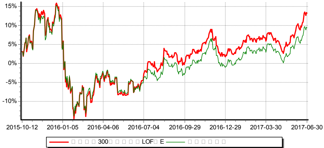
累计净值增长率与业绩比较基准收益率历史走势对比图 （2015年10月12日-2017年06月30日）

注：本基金自2015年10月8日起新增E类份额，图示日期为2015年10月12日至2017年6月30日。