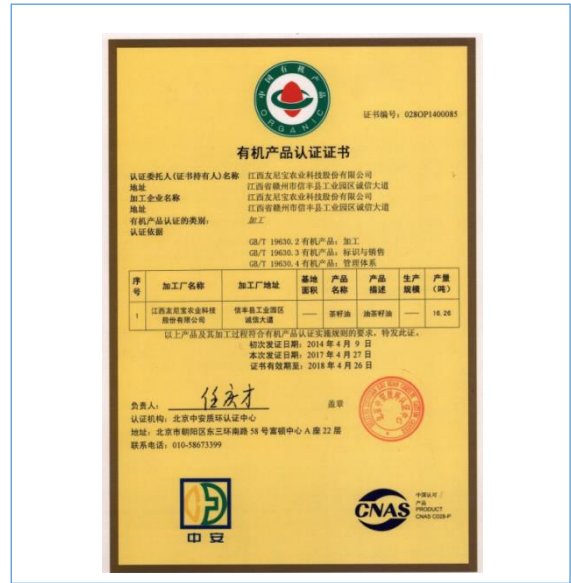
2017年4月27日公司产品油茶籽、油茶籽油获有机产品认证