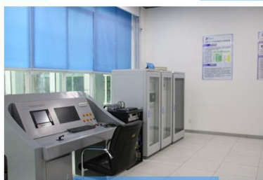
车载接口仿真系统