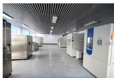
环境可靠性实验室