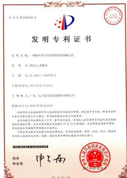
2015年7月23日公司申请了“一种胎中彩日用玻璃陶瓷的制备方法”，于2017年5月取得专利权证书。