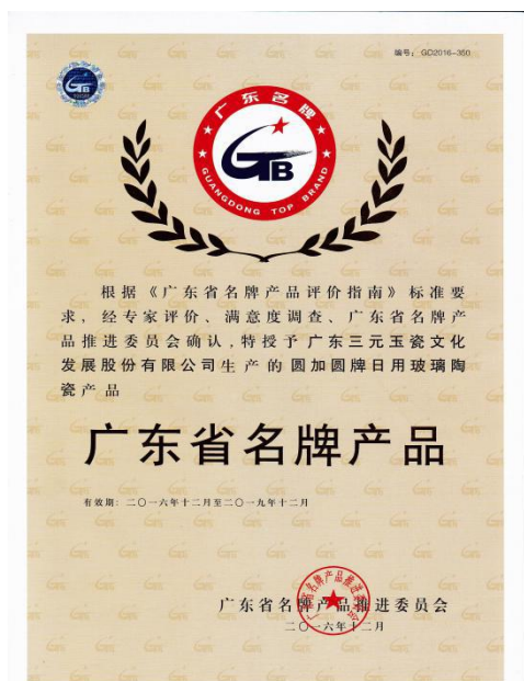
2016年12月公司日用玻璃陶瓷产品荣获“广东省名牌产品”称号。