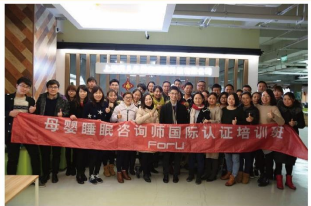
芙儿优“2017首届母婴睡眠咨询师国际认证培训班”，特邀英国耶鲁大学博士后Monica Roosa Ordway、美国布朗大学医学博士Judith Owens网络视频授课。