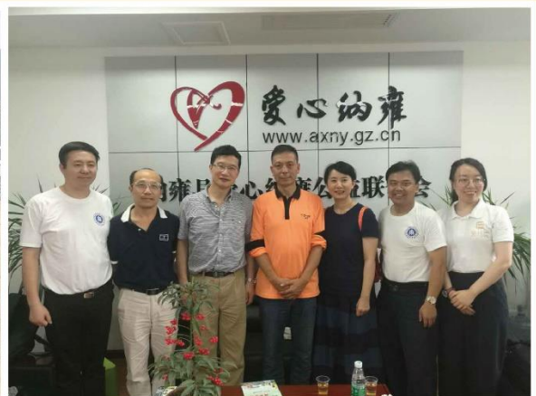
关爱失依儿童，走进纳雍，芙儿优关爱孩子优质睡眠。