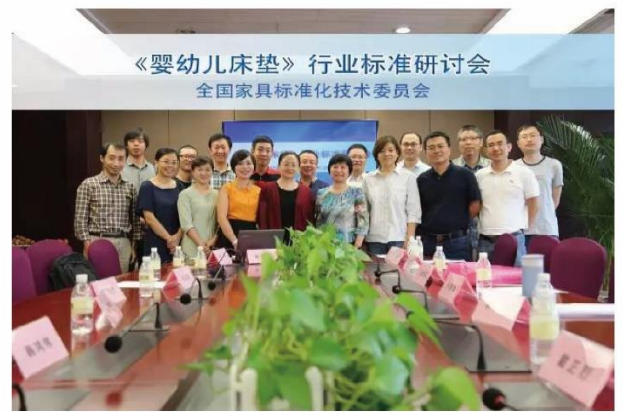
芙儿优公司参与并承办《婴幼儿床垫》行业标准研讨会