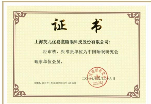
中国睡眠研究协会理事单位会员