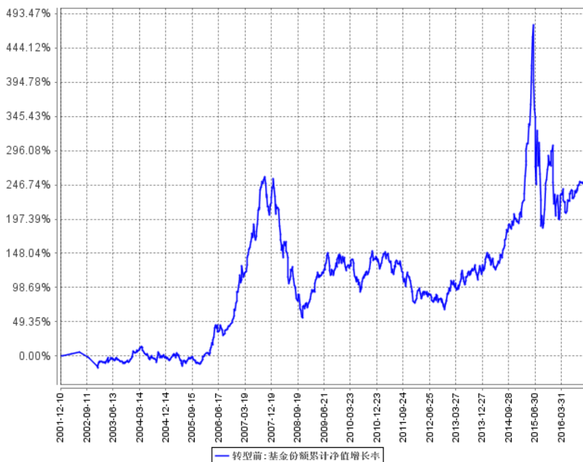
基金份额累计净值增长率与同期业绩比较基准收益率的历史走势对比图

注：1、按基金合同规定，本基金自基金合同生效之日起的 6 个月内为建仓期。建仓期结束时本基金的各项资产配置比例符合基金合同中的相关约定。