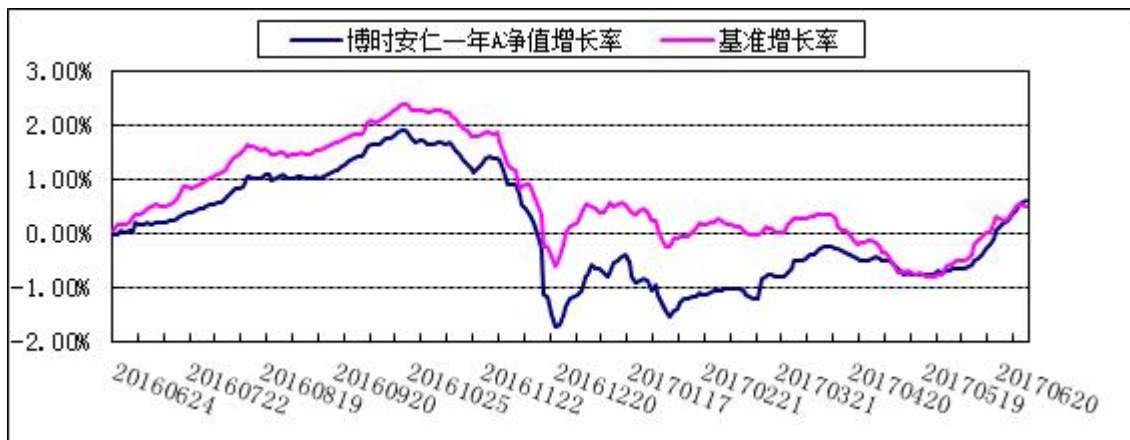
博时安仁一年定开债 C