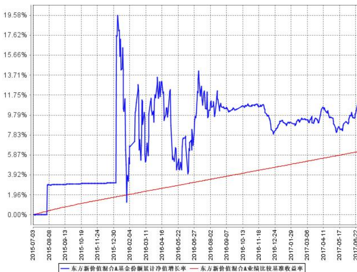
东方新价值混合A基金份额累计净值增长率与同期业绩比较基准收益率的历史走势对比图