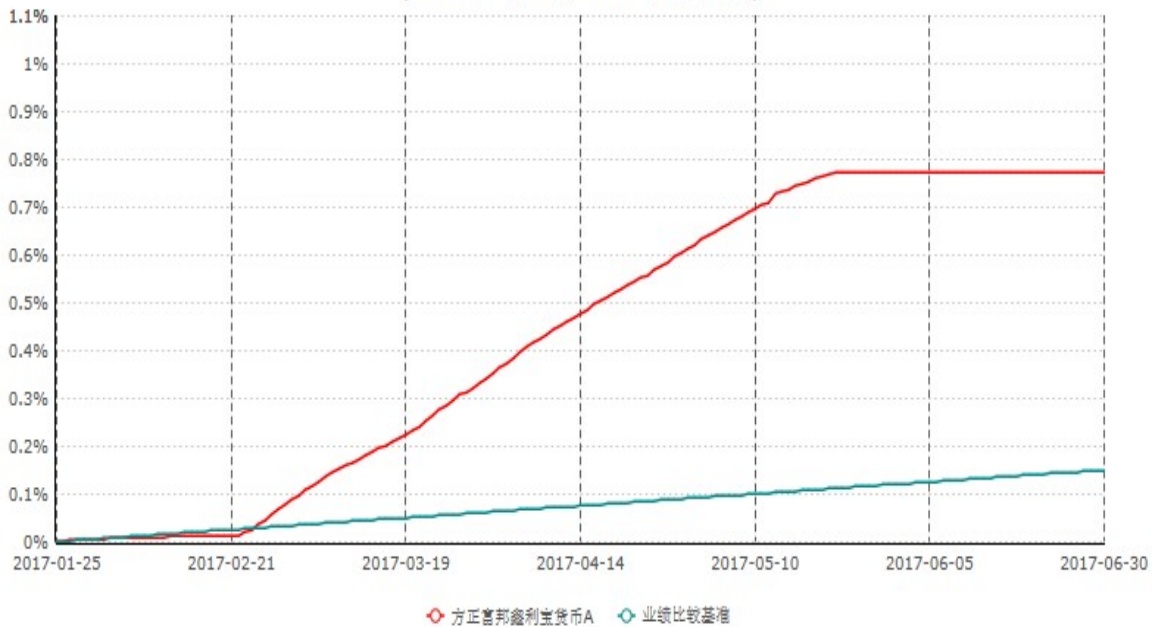
方正富邦鑫利宝货币A份额累计净值收益率与业绩比较基准收益率历史走势对比图 (2017年01月25日-2017年06月30日)