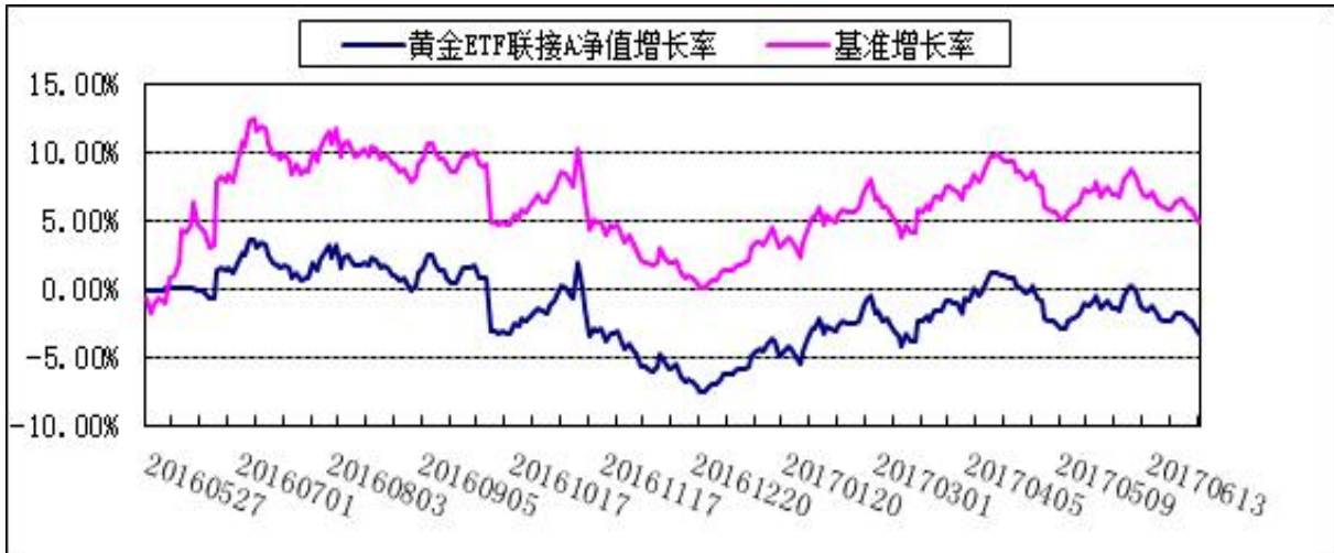
博时黄金 ETF 联接 C