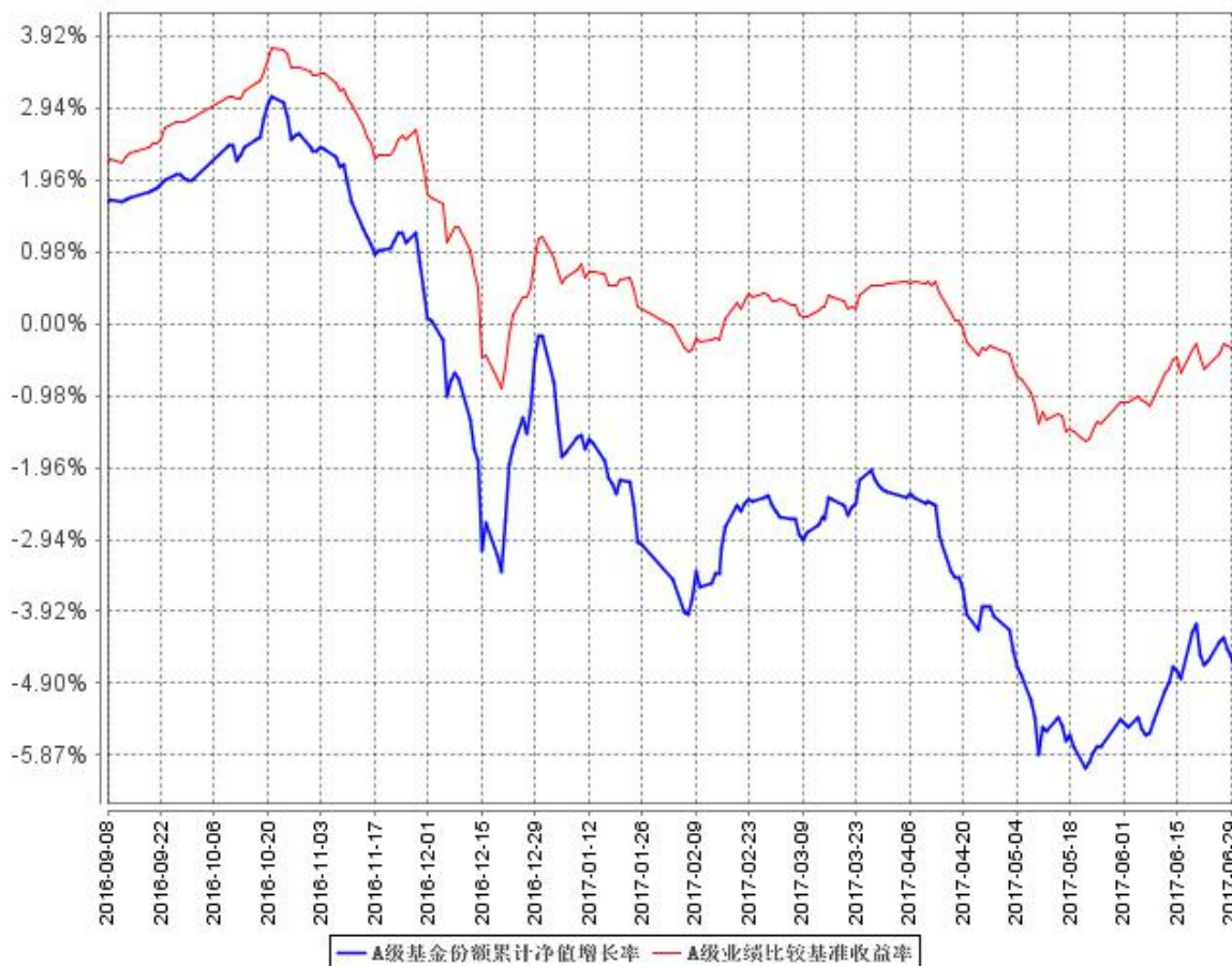
A级基金份额累计净值增长率与同期业绩比较基准收益率的历史走势对比图