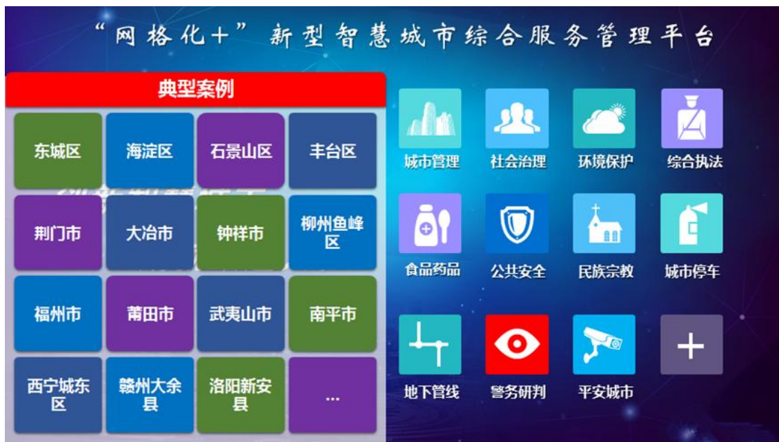
“网格化+智慧城市”的多网融合应用

报告期内，公司秉承“网格化+”智慧城市的建设模式，在安徽省合肥市、湖南省益阳市、黑龙江省桦南县等市、县多地积极推进智慧城市项目建设，符合城市执法体制改革的相关要求，切实站在城市管理者的角度出发寻找管理痛点、难点，并对症下药，建设具有其特色的智慧城市系统。数字化城市管理经过十多年的发展实践，已经得到各省、市、自治区的实践肯定和中央文件的正式认可。数字化城市管理的网格化管理理念不仅适用于城市管理，而且已经拓展至环境监管、社会服务管理、食品药品监管等智慧城市业务领域。公司已助力了多地打造了“网格化+”新型智慧城市经典案例，福州市以网格化管理模式为依托，创新性将城市管理、社会治理、环境保护等管理内容纳入网格化管理范围，形成“网格化定责，精细化履职，信息化支撑，社会化参与”的社会服务管理工作新机制，实现对人、地、物、事、组织等各类社会工作对象底数清、情况明、动态掌握、责任到位，实施无缝隙、精细化的服务与管理。同时，北京东城区、海淀区、石景山区，福建省福州市，湖北省黄石市、荆门市，江西省武夷山市等城市都在加快多网融合项目建设，未来将推广到更多地区。