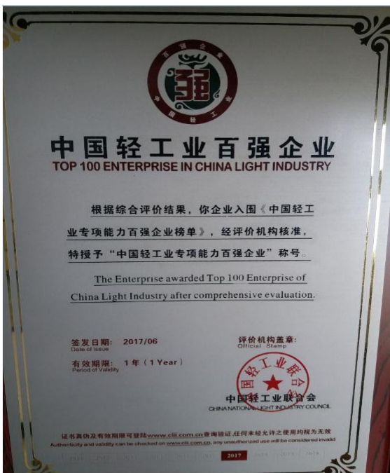
2017 年 6 月公司获得“中国轻工业专项能力百强企业”称号。