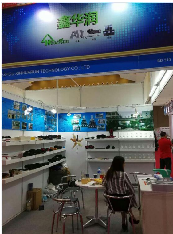
为扩展公司国外市场份额，2017 年 5 月参加第十二届印度尼西亚国际皮革与鞋类工业展览会。