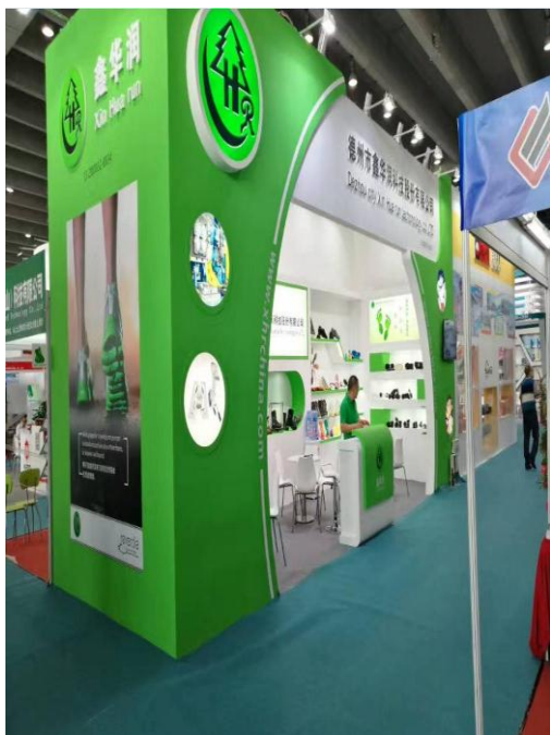
2017 年 6 月参加第二十七届广州国际鞋类、皮革及工业设备展览会。