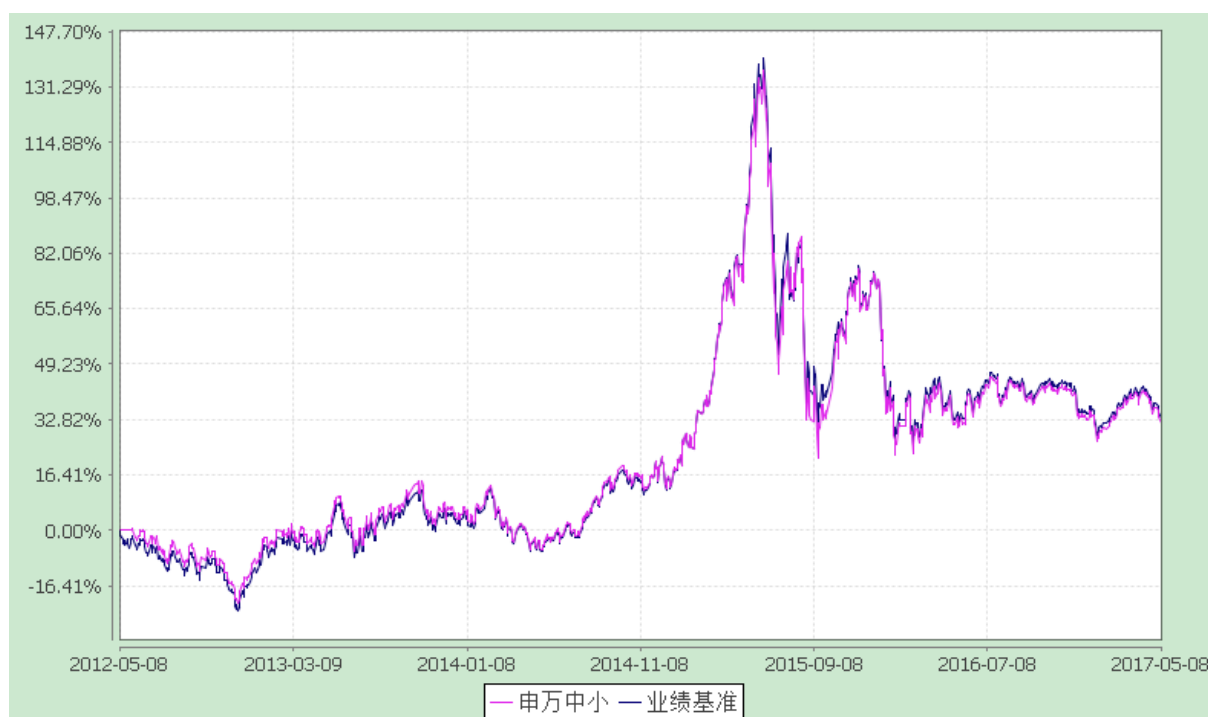
申万菱信中小板指数分级证券投资基金 份额累计净值增长率与业绩比较基准收益率历史走势对比图 (2017年1月1日至2017年5月8日)

注：1.根据《基金合同》的相关规定，原申万菱信中小板指数分级证券投资基金分级运作期共包含五个运作周年。分级运作期结束，无需召开基金份额持有人大会，自动转换为上市开放式基金（LOF）。2017年5月8日，申万菱信中小板指数分级证券投资基金分级运作期结束，申万菱信中小板指数分级证券投资基金之稳健收益类份额、申万菱信中小板指数分级证券投资基金之积极进取类份额按照《基金合同》约定折算成场内申万菱信中小板指数分级证券投资基金之申万中小板份额，基金名称变更为“申万菱信中小板指数证券投资基金（LOF）”；