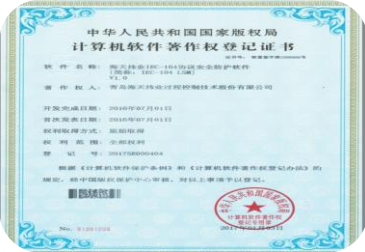
2017年1月，获得《IEC-104协议安全防护软件》软著登记证书