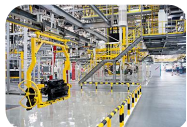
2017年海天炜业工控网络安全进入汽车生产领域