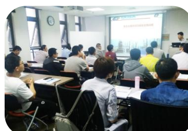
2017年6月，承办中国化学品安全协会《安全仪表系统功能安全培训班》