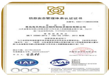
2017年5月，海天炜业喜获ISO27001信息安全管理体系统认证证书