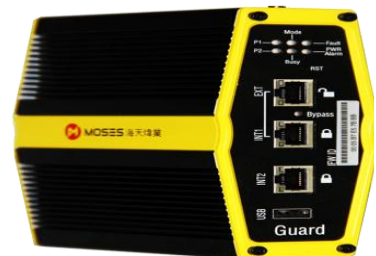
2017年5月，海天炜业Guard工业防火墙入围“青岛名牌”培育计划