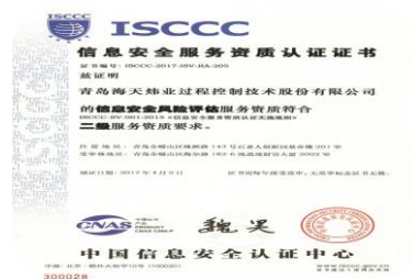
2017年4月，海天炜业通过信息安全风险评估资质认证