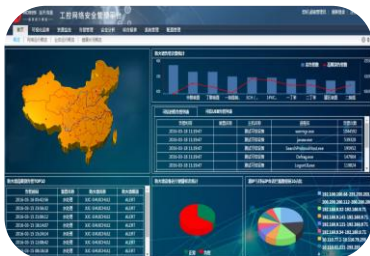
2017年4月，海天炜业工控网络安全事业部成立