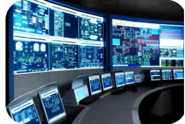
2017年3月，海天炜业智能化事业部成立