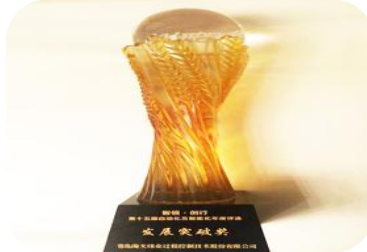
2017年2月，中国智能制造服务年会荣膺“发展突破奖”