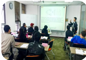
2017年4月，举办exida大中华区CFSE/CFSP/FSP功能安全认证培训