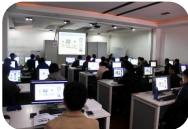
2017年4月，举办石油化工装置维护保运工程师（控制系统）培训班