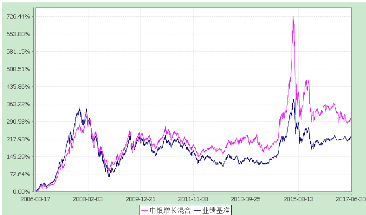
中银增长混合 H 类